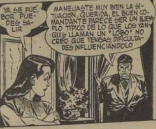
QUE NO TE OIGA MARGARITA DECIR ESO