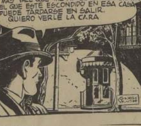
NO PROCEDE COMO PERSONA AGRADECIDA