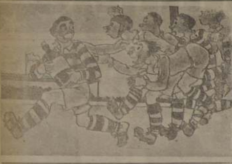
DUELO EN EL ATLETICO ORQUIDEA