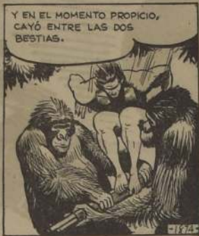
Y EN EL MOMENTO PROPIO, CAYÓ ENTRE LAS DOS BESTIAS.