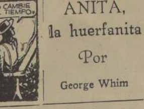
ACASO CAMBIE CON EL TIEMPO