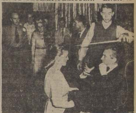
Bette Davis y Claude Rains ensayan una escena de su última película en los estudios de Warner Bros.

Un nuevo triunfo en su carrera cinematográfica ha conseguido la trágica del cine Bette Davis con su película "Engaño", que se está exhibiendo en la pantalla del Teatro Rex, con la aceptación de todos los amantes del séptimo arte.