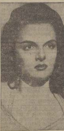
JANE RUSSELL, bautizada en los circuitos cinematográficos como "La Reina de los Corpiños", se presentará muy pronto en nuestra capital en la película "El proscrito".