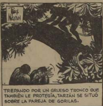
TREPANDO POR UN GRIOSO TRONCO QUE TAMBIÉN LE PROTEGÍA, TARZAN SE SITUÓ SOBRE LA PAREJA DE GORILAS.