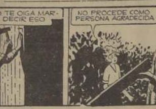
ES MUY ORGULLOSO