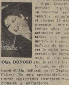
Olga DONOSO, popular figura de nuestros escenarios, cumple el viernes 24 del presente mes, treinta años de actuación en las tablas. Con este motivo sus compañeros de labores le están preparando un homenaje, el que se efectuará el día indicado en el Teatro Colón. En esta oportunidad actuarán capacitados elementos nacionales y extranjeros.