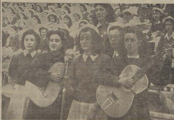
LA "BARRA" DEL LICEO N.º 3.— Llevaban guitarras y solistas, que llamaron la atención las alumnas del Liceo N.º 3.