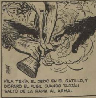
KILA TENÍA EL DEDO EN EL GATILLO, Y DISPARÓ EL FUSIL CUANDO TARZAN SALTÓ DE LA RAMA AL ARMA.