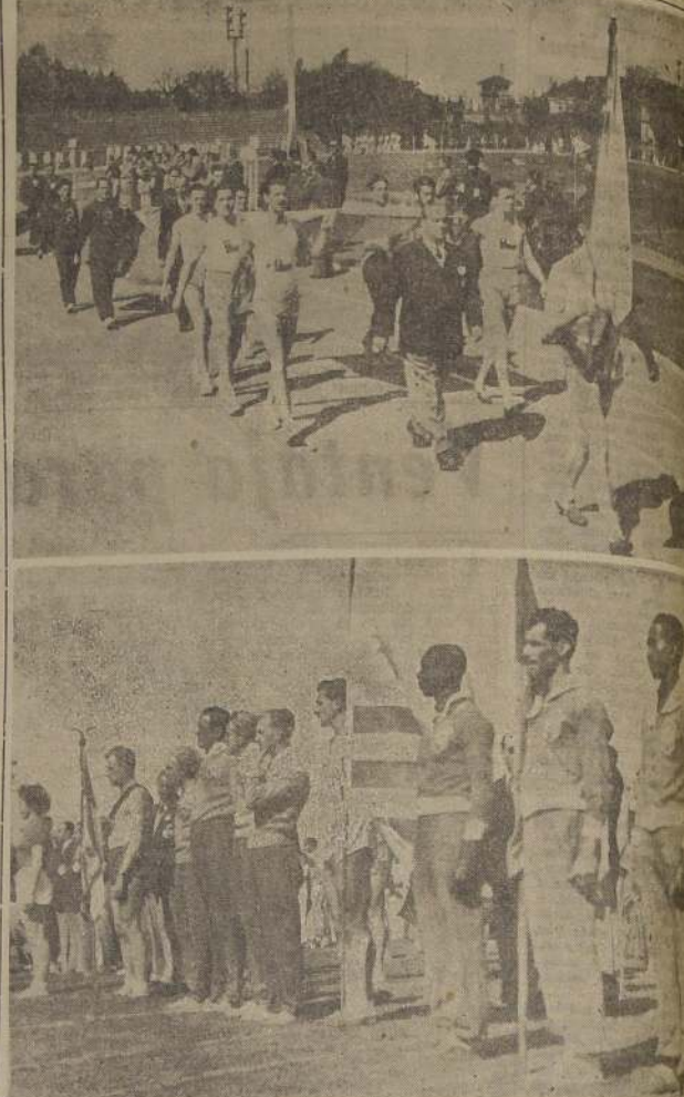
En la pista Jorge Newbery, los chilenos brillaron junto a los ases mundiales, respectivamente, en el torneo de tenis, en el cual participaron los mismos jugadores que actúan en el XV Torneo Sudamericano por la Copa Mitre.