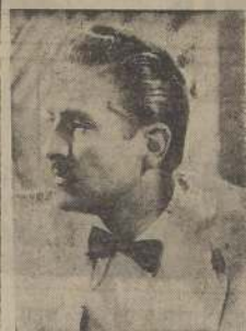
ARTURO DE CORDOBA

Enamorada, que aún no ha sido estrenada en Chile. En "Su última aventura" este elemento logra un nuevo acierto fotográfico, el cual será apreciado por los amantes del cine, cuando se estrene esta producción.