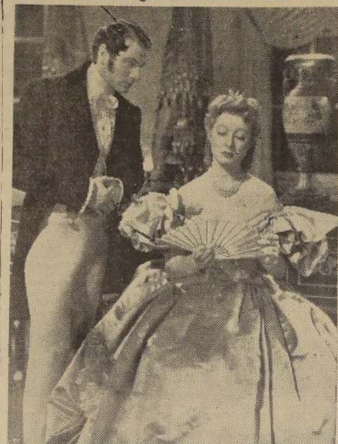
Greer Garson y Laurence Olivier, intérpretes de "Adios, Mr. Chips" y "Rebecca", respectivamente, reaparecerán hoy, en la pantalla del Teatro Metro, en "Mas Fuerte que el Orgullo".

En las funciones de Matinee, Verano y Noche de hoy en el Teatro Metro, se conocerá la visión cinematográfica de Metro-Goldwyn-Mayer titulada "Mas Fuerte que el Orgullo". Esta producción, catalogada como obra maestra del cine, es una adaptación de la novela inglesa "Fried and Prejudice". Novela de costumbres en un ambiente de la vieja Inglaterra de 1850, con todos sus prejuicios y el orgullo de sus gentes. Relato romántico, gracioso e impregnado de una suave ironía y un delicado buen humor, cuenta la historia de cinco muchachas sin dote, como quien dice cinco mujeres condenadas a la perpetua soltería. Estas cinco muchachas son hermanas y solo cuentan, para conseguir marido, con los siguientes atributos: Talento, simpatía, excelente educación y unos deseos locos de casarse. La madre de ellas, vieja en estas lides, astuta y hábil, logra tras luchas sin cuento "volocarlas" a todas. Tarea de titanes, batalla continua, diálogos con palabras que