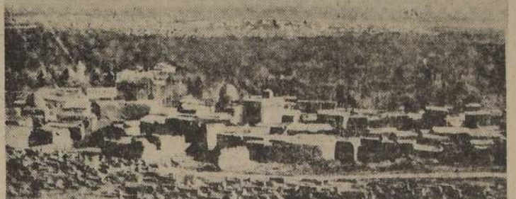
Vista panorámica de Damasco, una de las dos más importantes ciudades de Siria, junto con Beirut, y que son los principales objetivos de las fuerzas británicas comandadas por el general Wilson y de Francia Libre por el general Catroux.

Cerca de la costa del Líbano, durante un encuentro naval de nuestra escuadra contra una escuadra británica más poderosa, resultó gravemente dañado un torpedero británico. En todas partes nuestras fuerzas se mantuvieron fieles al deber militar y opusieron tenaz resistencia a un enemigo numéricamente superior y poderosamente armado."