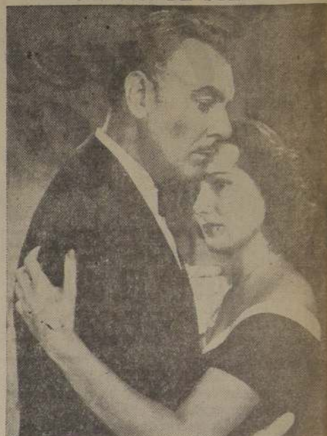
Brenda Marshall y George Brent, protagonistas de la película Warner Bros. que hoy estrena el Victoria.