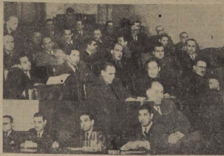
Una parte de los miembros de la Junta Central Radical que asistieron a la sesión de anoche, en que fue acordado el retiro de los Ministros radicales del Gabinete. En el ángulo inferior izquierdo, los miembros de la Mesa Directiva, en el momento de ser votado el proyecto de acuerdo.