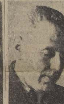
Señores Luis Alamos Barros, Marcial Mora Miranda, Juan Antonio Iribarren, Juvenal Hernández y Alfonso Quintana Burgos, que, en conformidad al acuerdo adoptado anoche por la Junta Central del Partido Radical, deberán presentar sus renuncias a los cargos de Ministros de Relaciones Exteriores y Comercio, de Hacienda, de Educación Pública, de Defensa Nacional y de Agricultura, respectivamente.