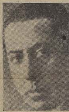
Señores Luis Alamos Barros, Marcial Mora Miranda, Juan Antonio Iribarren, Juvenal Hernández y Alfonso Quintana Burgos, que, en conformidad al acuerdo adoptado anoche por la Junta Central del Partido Radical, deberán presentar sus renuncias a los cargos de Ministros de Relaciones Exteriores y Comercio, de Hacienda, de Educación Pública, de Defensa Nacional y de Agricultura, respectivamente.