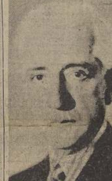
Señores Luis Alamos Barros, Marcial Mora Miranda, Juan Antonio Iribarren, Juvenal Hernández y Alfonso Quintana Burgos, que, en conformidad al acuerdo adoptado anoche por la Junta Central del Partido Radical, deberán presentar sus renuncias a los cargos de Ministros de Relaciones Exteriores y Comercio, de Hacienda, de Educación Pública, de Defensa Nacional y de Agricultura, respectivamente.