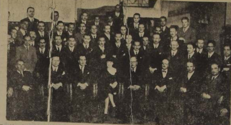
Comida ofrecida en el Savoy por los alumnos del sexto año de ingeniería de la Universidad de Chile, con motivo de su próximo viaje de perfeccionamiento a la Universidad de Michigan, de Estados Unidos. Estos alumnos fueron distinguidos con becas de la Fundación Kellogg.