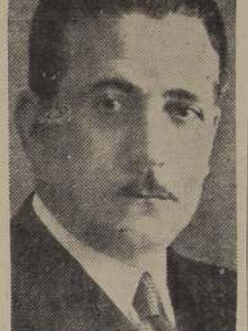
Presidente Alfredo Baldomir