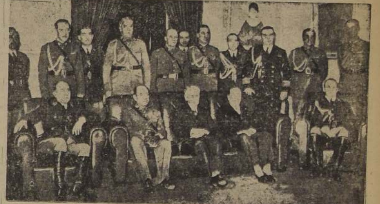
El Presidente de la República Argentina, el Ministro de Guerra, el Embajador de Chile y la Delegación Militar de Chile.