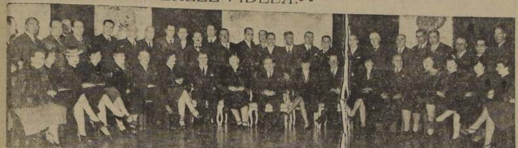
Comida ofrecida por los senadores y diputados radicales, en el Hotel Carrera, al Embajador de Chile en Rio de Janeiro, don Gabriel González Videla y señora, con motivo de dirigirse próximamente a asumir su cargo.