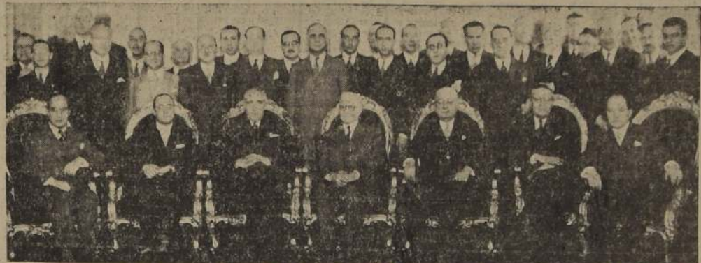
S. E. el Presidente de la República acompañado de los delegados a la primera reunión plenaria del Consejo Permanente de Asociaciones Americanas de Producción de Comercio, que lo visitaron ayer

A mediodía de ayer S. E. ofreció un cocktail en honor de los delegados extranjeros. — En la reunión plenaria de la tarde se trataron importantes materias