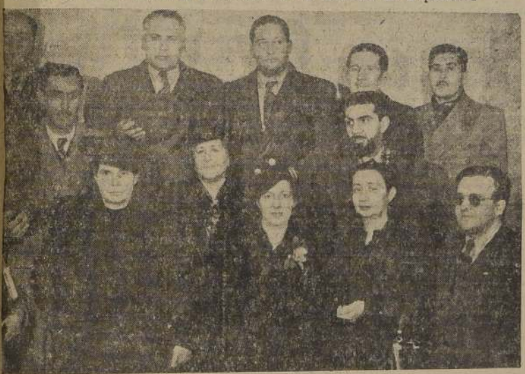
Dirigentes de la Unión de Profesores durante la visita que efectuaron ayer a LA NACION