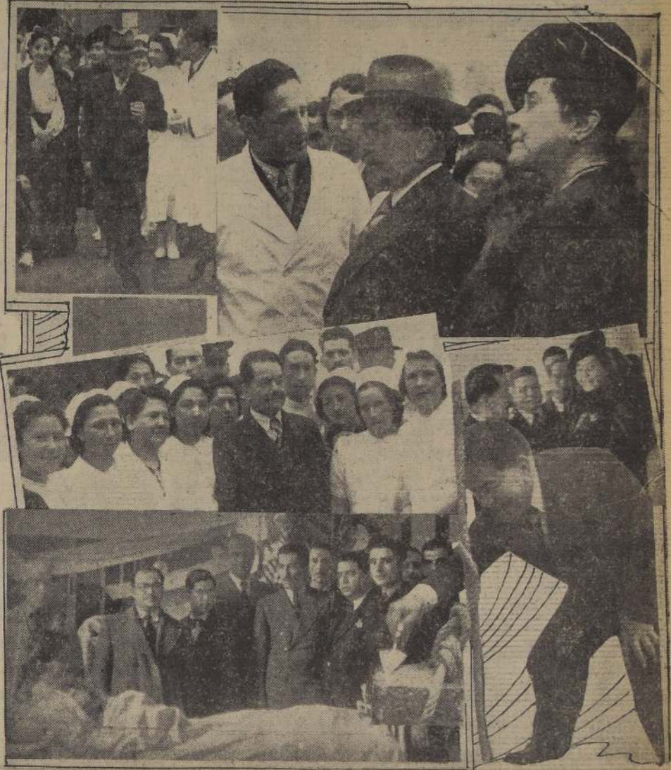
El mosaico muestra diversos aspectos de la celebración del "Día del Hospital". — Aparecen en el S. E. y señora Juana Aguirre Cerda colocando la primera piedra del nuevo pabellón de enfermos infecto-contagiosos que se construirá en el Hospital "Barros Luco"

Como expresamos en líneas anteriores, fue digno de notar el interés demostrado por el público por asistir a estas festividades. Los hospitales recibieron la visita de personas de todas las clases sociales durante todo el día, habiéndose calculado en