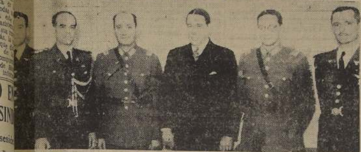
Comandante del Brasil, Comandante en Jefe del Ejército, Jefe del Estado Mayor y aviadores brasileños durante el cocktail ofrecido en la Embajada del país hermano

Caron una corona de flores en el monumento que existe en la Escuela de El Bosque. — Los discursos. — Almuerzo en el Casino de Oficiales. — Otros festejos en honor de los pilotos visitantes