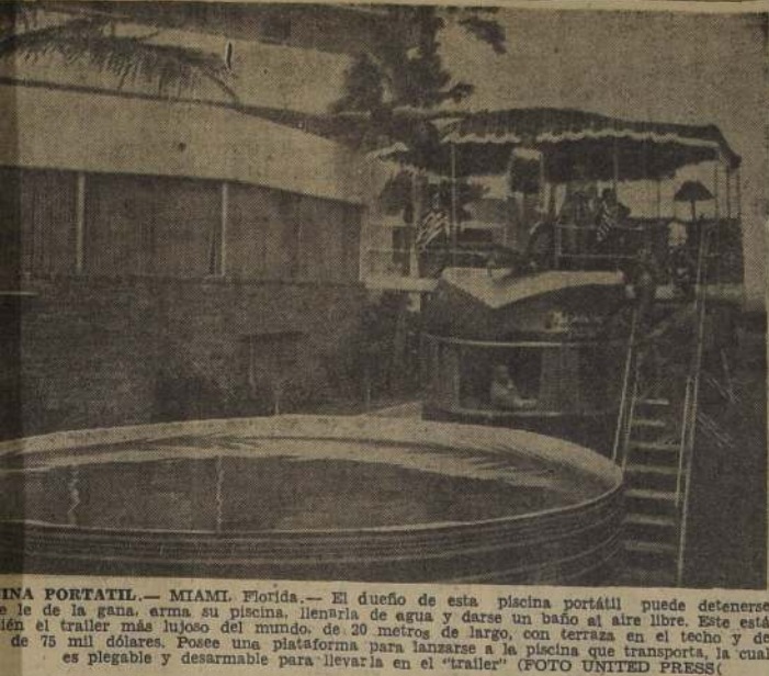
UNA PORTATIL. — MIAMI, Florida. — El dueño de esta piscina portátil puede detenerse a le de la gana, arma su piscina, llenarla de agua y darse un baño al aire libre. Este está en el trailer más lujoso del mundo, de 20 metros de largo, con terraza en el techo y de 75 mil dólares. Posee una plataforma para lanzarse a la piscina que transita, la cual es plegable y desarmable para llevarla en el "trailer"