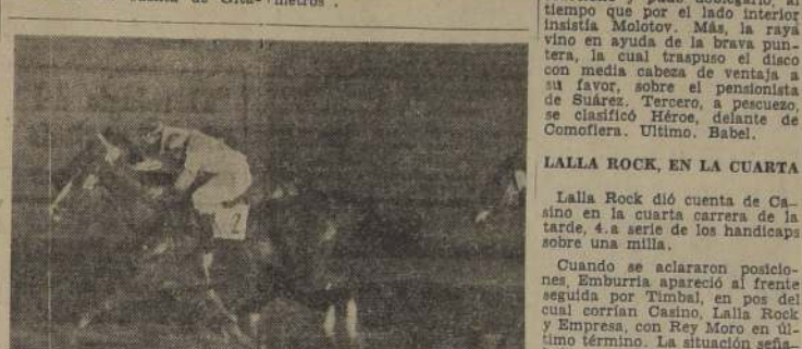
REINOSO, por fuera empató sobre la misma raya a Salmonella, en la séptima carrera de la tarde. Tercera se clasifica Luminaria.

ALADA EN LA TERCERA En uno de los finales más estrechos de la tarde, Alada venció a Molotov, al final de la primera serie de los handicaps sobre 1.200 metros.