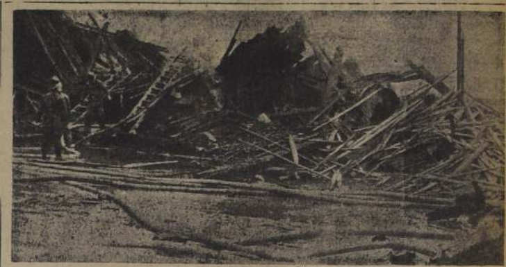
SOLO QUEDA UN MONTON DE ESCOMBROS. — El grabado muestra el aspecto que presentaba ayer la barraca Schultz, donde se inició el fuego. De ella sólo queda un montón de escombros humanos, en el cual trabajan los voluntarios de las diferentes compañías de bomberos en la búsqueda de cadáveres.