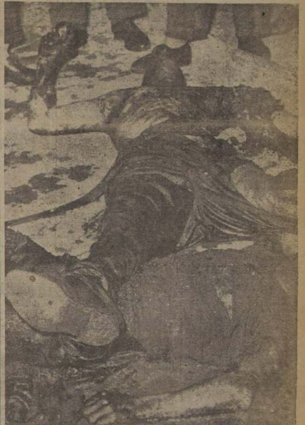
UN MINUTO DESPUES DE LA EXPLOSION.— La foto —to mada 60 segundos después de la explosión— capta el impresionante aspecto que ofrecía en la madrugada de ayer la Barraca Schultz. La llamarada de la explosión alumbró a Valparaíso. Derecha: Uno de los numerosos cadáveres, carbonizado, resume el drama que sacudió a Chile