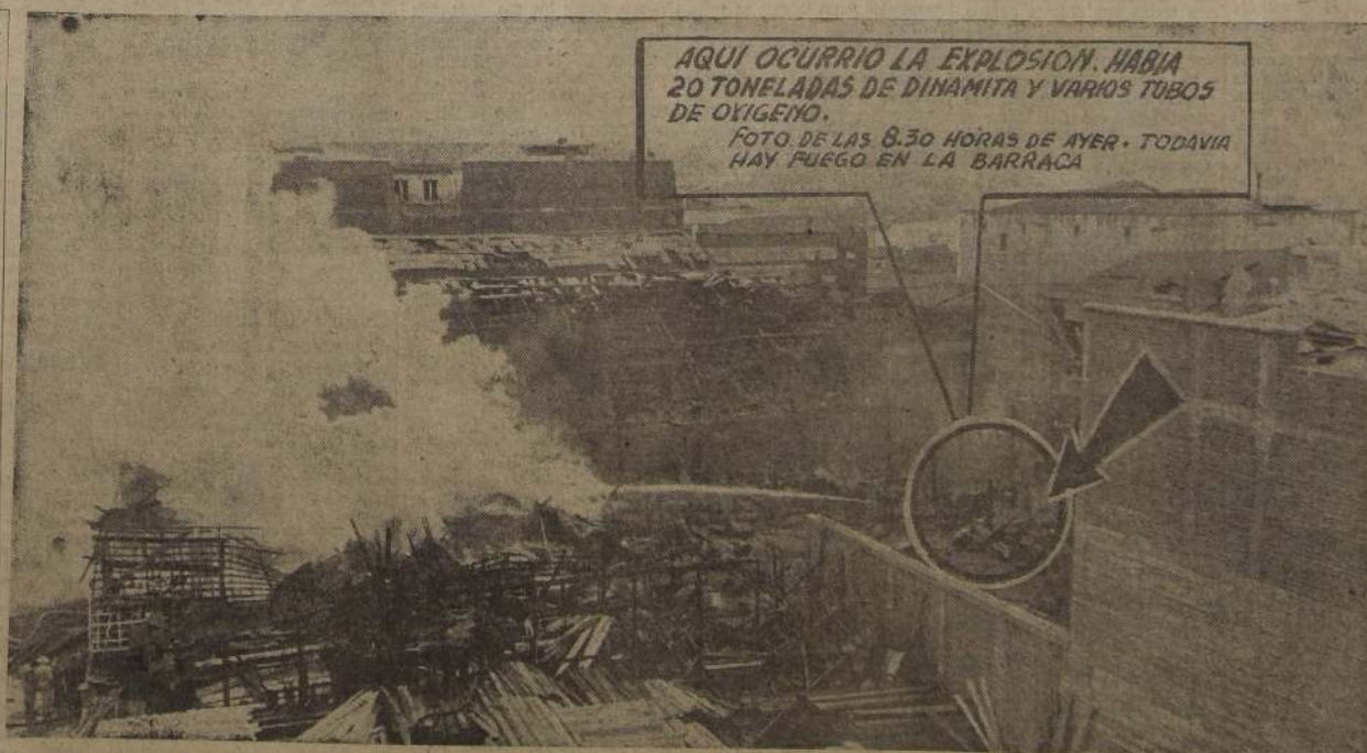
AUN ARDE LA BARRACA.— A las 8.30 de la mañana, los escombros de la Barraca Schultz humean todavía. 48 muertos, 340 heridos, resumen el drama que estremeció a Chile en su noche de Año Nuevo. 35 muertos están identificados y otros 13 son restos informes

Saldo y suma de la noticia que traspasó rápidamente nuestras fronteras, para golpear dramáticamente el pulso de la actualidad mundial.