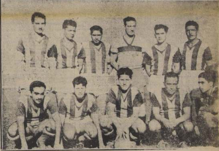
GANÓ EL CAMPEON.—En primer término, el equipo del Carioca, campeón de la Asociación Santiaguina y vencedor del Juventud Católica por 6 a 2. En seguida, el La Cruz que derrotó al Apolo por 4 a 2. En último término, el equipo del Olimpia que opuso resistencia al Ferrovial, nada más que en los 45 minutos iniciales.