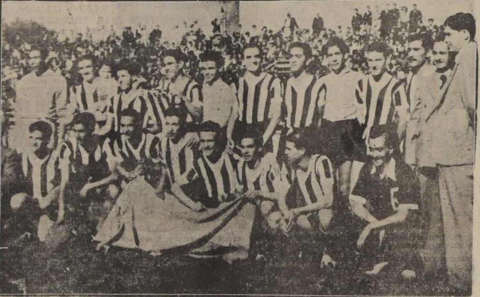
ACTUO CON EXITO.— Equipo Juvenil del Club Gimnasia y Esgrima de Mendoza, que se presentó en Concepción, ciudad de la que regresó invitado después de dejar excelente impresión.

Llamó grandemente la atención el excelente estado físico de los jugadores, como al mismo tiempo, la corrección con que siempre actuaron en la cancha, cuando los jugadores del equipo fueron adversos. En el match de revancha con la selección de Concepción, fueron castigados con un tiro penal, falta que no cometieron, y sin embargo la acataron con todo respeto, significando el empate a los penales, lo que marcó el punto. Este ejemplo de los juveniles es digno de aplauso, pues en cuadros profesionales habría dado motivo a serias dificultades e incidencias.