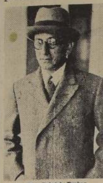
Dr. Gabriel Turbay

G. Turbay herido en manifestación política en Cali