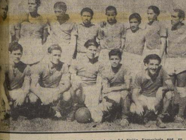
CONJUNTO TRIUNFAR FERROVIARIO.— Arriba, el conjunto del Unión Ferrovial que, en su victoria, venció al Olimpia. Al centro, Famae, ganador del viejo club Loma Blanca (5 a 3). Abajo, el elenco del Juventud Católica de Nuñoa, cuadro que sorpresivamente aventajó al Carioca, hasta los 15 primeros minutos.