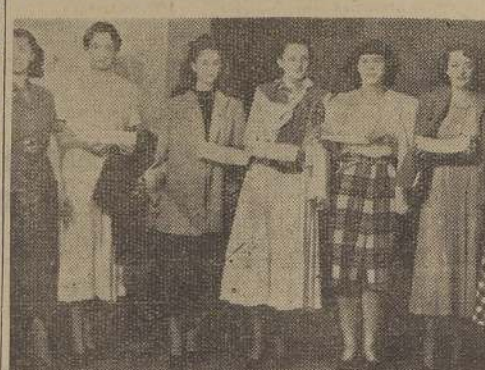
Parte de las señoras que gentilmente actuaron en la presentación de modelos de ción nacional, que tuvo lugar en los salones del Hotel Carrera, el jueves pasado, a beneficio para la Cruz Roja de la Granja.