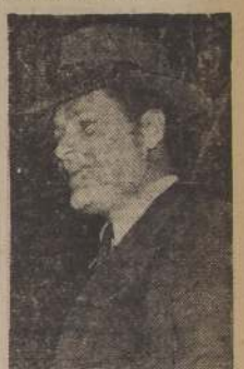
Jacob Lomakin, Cónsul General de Rusia en Nueva York

El Cónsul General en Nueva York, es posiblemente, el funcionario soviético de mayor jerarquía en Estados Unidos, después del Embajador. Fue enviado a un otro Consulado General en este país, y está ubicado en San Francisco de California.