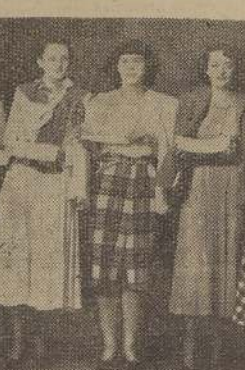
Parte de las señoras que gentilmente actuaron en la presentación de modelos de ción nacional, que tuvo lugar en los salones del Hotel Crillon, el jueves pasado, a beneficio para la Cruz Roja de la Granja.