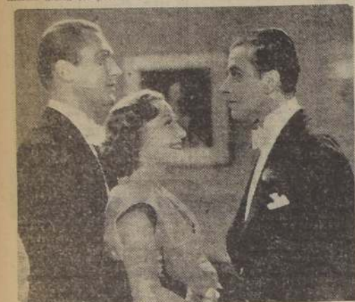
Joan Crawford, con su nuevo galán, Brian Aherne, y Fred Keating, en "Yo vivo mi vida", producción Metro-Goldwyn-Mayer

En breve la Empresa del Teatro Splendid iniciará sus grandes actividades cinematográficas del otoño de 1936. En el año 1934, esta misma Empresa, colocó dicha temporada con "La