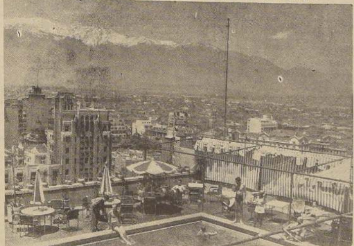
"Florida", del Hotel Carrera, aparte de sus confortables servicios brinda al habitué un magnífico panorama de Santiago.