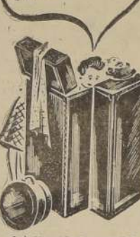
BASE: Ilustración de Magnesia.