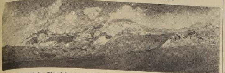
Cumbre del volcán Planchón, a cuyos pies están las lagunas del mismo nombre y la de Teno, donde se encuentran bloqueadas 200 personas

AUTORIDADES DE CURICO ENVIARON AUXILIOS POR TIERRA LOS CUALES YA ESTAN EN "LOS QUEÑES" — LA BOR DE LA DIRECCION DE AUXILIO SOCIAL—INFORME DEL DEPARTAMENTO DE HIDRAULICA DE LA DIRECCION DE OBRAS PUBLICAS SOBRE EL TEMPORAL — INFORMACIONES DE NUESTROS CORRESPONSALES