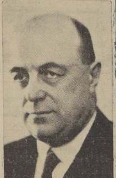
Wladimiro Smetana, Ministro de Checoslovaquia en Chile