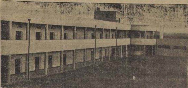
Vista interior de la primera escuela primaria que entregará la Sociedad Constructora de Establecimientos Educativos, en calle Tocornal número 1425

Concurrirán a este acto S. E. el Presidente de la República, Ministros de Estado y autoridades educacionales