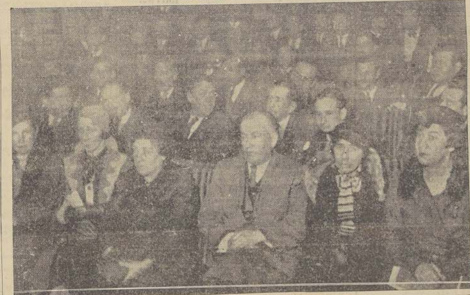
Durante la velada de ayer en la Universidad.

El Ministro de Educación presidió ayer el acto de repartición de premios en la Universidad. — Distinguidas personalidades, ex-alumnos del Colegio, recordarán hoy su vida de estudiantes en un almuerzo íntimo