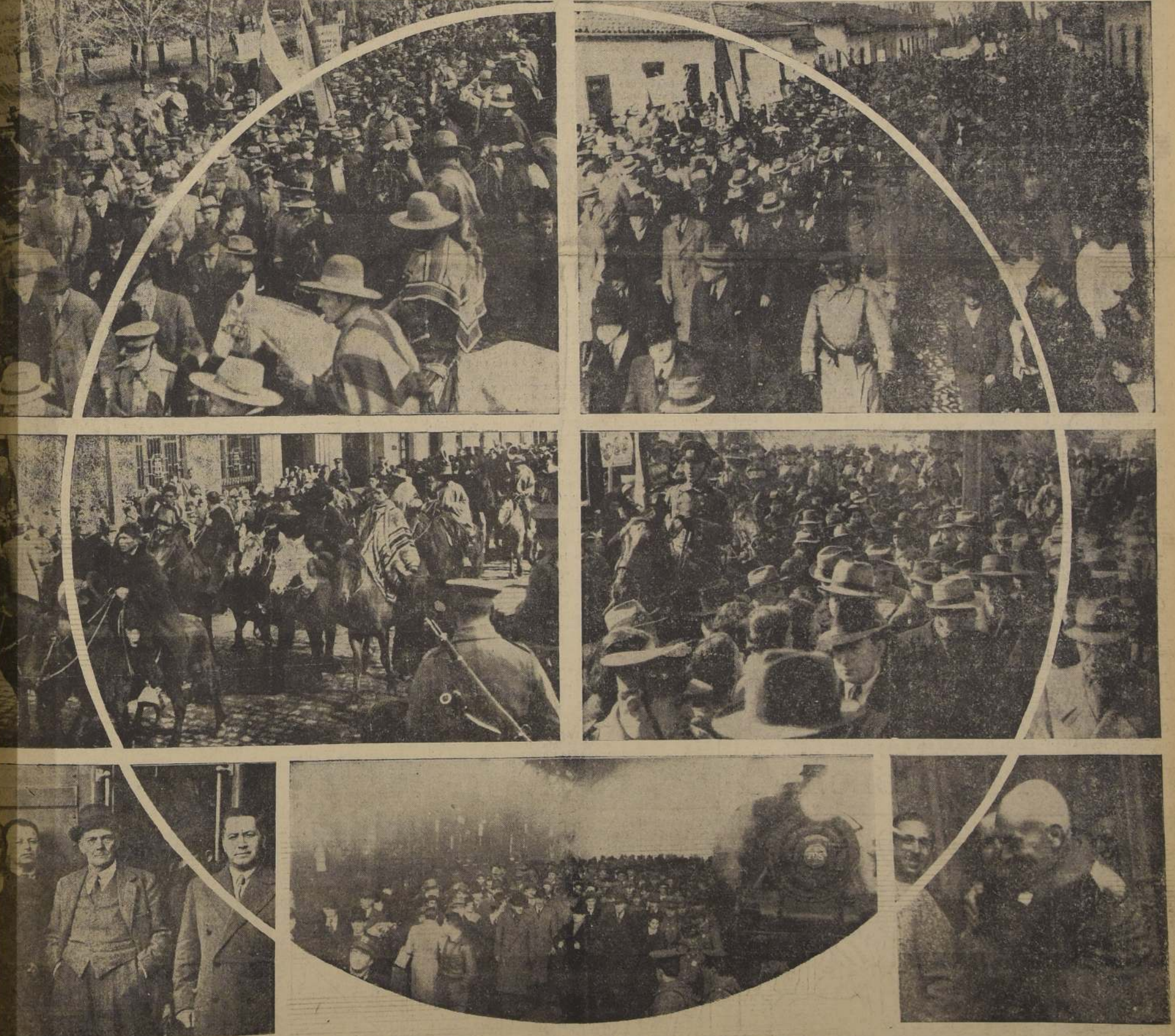
El reportero gráfico captó, entre muchos otros, estos aspectos de los vibrantes homenajes que las provincias de la zona central sur tributaron al candidato de las fuerzas de orden, señor Gustavo Ross, en su tercera jira por las provincias del sur, con estas elocuentes demostraciones, expresaron su adhesión inquebrantable al candidato nacional y su decidido propósito de hacer triunfar en octubre la causa de la cual es su más legítimo personero.— Abajo: al centro, una vista de la llegada, ayer, a la Estación Central.