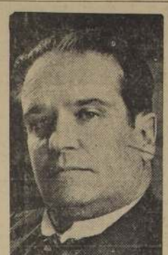
Don Hernando Siles, Ministro de Bolivia en Chile

general del Centro de Estudiantes Bolivianos.