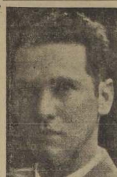
Excmo. señor Germán Busch, Presidente de Bolivia