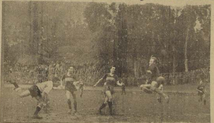
GOAL DE COLO COLO.— Iban 32' del primer tiempo. Centro Rojas, desde la línea de toque y Domínguez, con violento y bien dirigido cabezazo, venció a Soudy.

En la equitativa apreciación de los méritos destacados