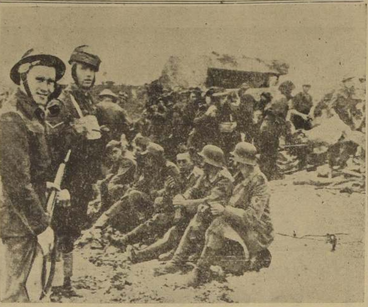
En esta extraordinaria vista, vemos a los primeros prisioneros alemanes capturados por tropas Canadienses en el asalto a la fortaleza de Europa. En el fondo, a la derecha, se puede distinguir una casamata destruida por el fuego de los cañones navales — Radioteletro transmitida a Washington.

RECIA DEFENSA ANTIAEREA EN HAMBURGO Densas nubes cubrían la mayor parte de la zona de batalla, lo que en general el bombardeo debió efectuarse por medio de las