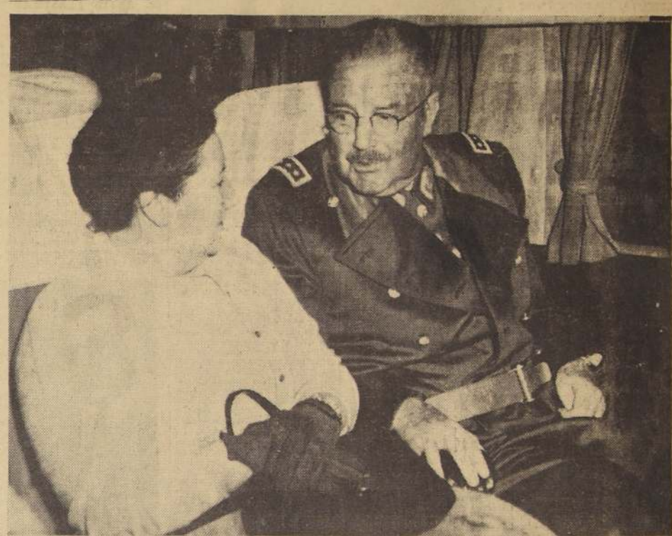
S. E. EL PRESIDENTE DE LA REPUBLICA y señora Graciela Letelier de Ibáñez, momentos antes de que el cuadrimotor LAN, DC-6B N.º 402, emprendiera vuelo a Punta Arenas, uniéndose a la ciudad más austral de Chile y del mundo, por primera vez, en un vuelo directo, desde la capital en sólo poco más de 4 horas.