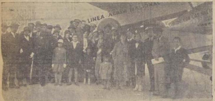
Los periodistas que llegaron ayer en avión

Primeros delegados que llegan a la Convención del Gremio. — Se ultiman los preparativos para la realización de este torneo