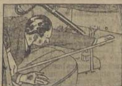
El compartimiento delantero del Sedán Ford V-8 de Dos Puertas mide 1.12 mts. de largo hasta el respaldo del asiento delantero.

Verifique las medidas Ud. mismo y vea cuánto mayor es el espacio para las piernas y la amplitud interior que le brinda el Ford V-8. Después maneje este automóvil y compruebe cuánto mayor es el valor que Ud. recibe por su dinero en punto a funcionamiento y comodidad de marcha.