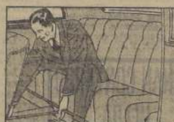
Compartimiento trasero: Ud. dispone de 66 cms. para las piernas entre el asiento delantero y el trasero en el Sedán Ford V-8 de Dos Puertas.

El compacto motor V-8 deja más espacio para los pasajeros