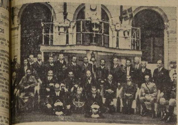
Grupo de asistentes a la manifestación de ayer.

Los distinguidos marinos fueron objeto de especiales atenciones en el local de esta institución y su presidente, el comandante don Santiago Zavala, les hizo entrega, en afectuosos términos, de tres insignias del "Caleuche".