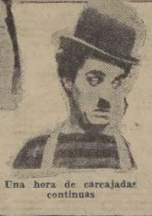
Una hora de carcajadas continuas

Nelson Eddy e Ilona Massey, principales protagonistas de la película "Balalaika", que estrenará el Teatro Metro, realizarán un concierto por radio, pasado mañana jueves