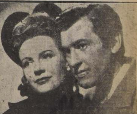
Arnoldo Calvert y Stewart Granger, la pareja romántica de "Amor en las sombras"