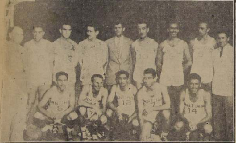
CHILENOS.—El Seleccionado local que es considerado como el mejor del país, ganó difícilmente a un team discreto, pero su labor no agradó al escaso público. A los players metropolitanos les falta entrenamiento.