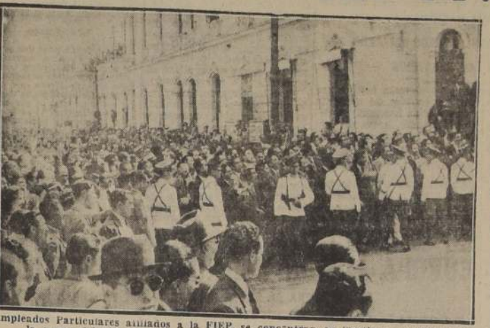
Empleados Particulares asaltados a la FIEP, se concentran en Teatinos con Huérfanos a la espera del término de la reunión en que se constituyó el Consejo de la Caja.

Desde las primeras horas de la mañana diversos grupos de empleados pertenecientes a las distintas centrales se fueron reuniendo en los lugares que habían indicado sus directivas con anticipación. La FIEP realizó un desfile por el centro y se concentraron en las calles Huérfanos y Teatinos, en espera del término de la sesión del Consejo de la Caja, para evitar la