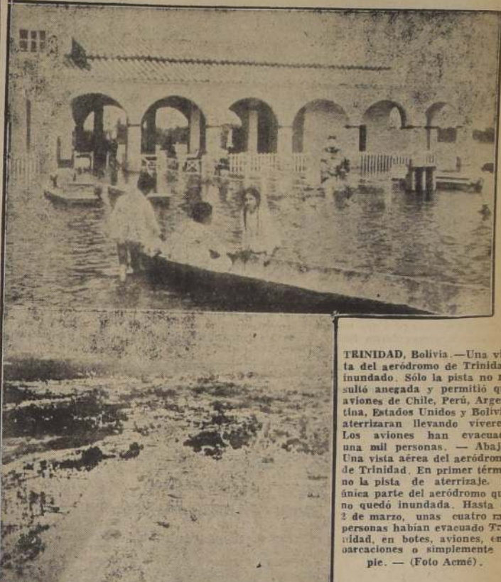
TRINIDAD, Bolivia. — Una vista del aeródromo de Trinidad, inundado. Sólo la pista no resultó anegada y permitió que aviones de Chile, Perú, Argentina, Estados Unidos y Bolivia, aterrizaran llevando víveres. Los aviones han evacuado una mil persona. — Abajo: Una vista aérea del aeródromo de Trinidad. En primer término la pista de aterrizaje, la única parte del aeródromo que no quedó inundada. Hasta el 2 de marzo, unas cuatro mil personas habían evacuado Trinidad, en botes, aviones, embarcaciones o simplemente a pie.