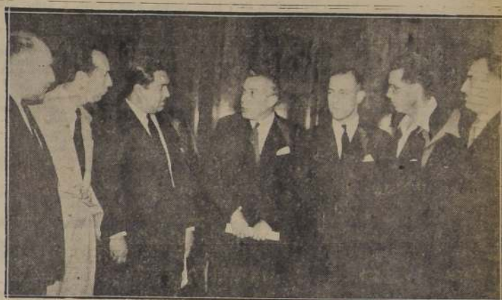
S. E. el Presidente de la República recibió ayer tarde a dirigentes de las organizaciones de empleados particulares de la CONSEP y CONEP, quienes le hicieron presente sus aspiraciones relacionadas con la representación en el Consejo de la Caja de Empleados Particulares.