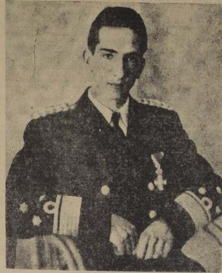
S. M. Pedro II de Yugoslavia, cuyo 20.º aniversario de su natalicio se celebra hoy.