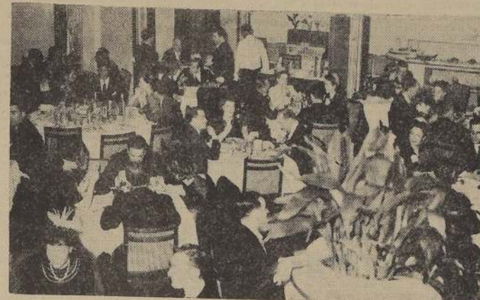
El Roof Garden durante una de sus reuniones sociales de la semana, concurrido, como de costumbre, por distinguidas familias.

Con motivo del 4.º aniversario del fallecimiento de la señora Graciela Zegers de Chapman, mañana se oficiará una misa por el eterno descanso de su alma, en la Parroquia de San Crescente, Av. del Salvador, a las 9 horas.