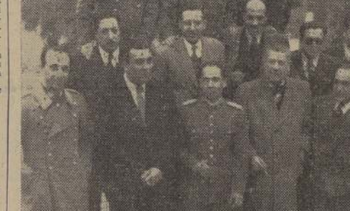
Asistentes al almuerzo ofrecido por los reporteros de Defensa Nacional

El sábado se efectuó en el Estado Militar el almuerzo que los periodistas que atienden las informaciones del Ministerio de Defensa Nacional, ofrecían a los Subsecretarios de esta Secretaría de Estado, en retribución a las atenciones y facilidades dispensadas por estos jefes a los representantes de la prensa.