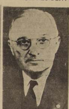
Excmo. señor Harry Truman

Como V. E. muy bien lo recuerda, la cooperación chilena a la causa de las