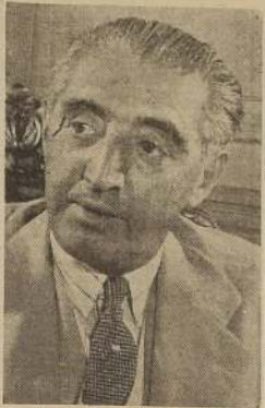
Excmo. señor don Juan A. Ríos

para mí que considerara Ud. posible una visita a Washington en octubre del presente año. Esa visita nos proporcionaría la oportunidad de cambiar puntos de vista sobre nuestras tareas concernientes a la prosecución de la guerra con el Japón, hasta su término victorioso, y para considerar