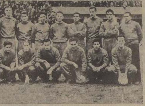
Equipo de Audax Italiano, que sigue de puntero en el torneo oficial