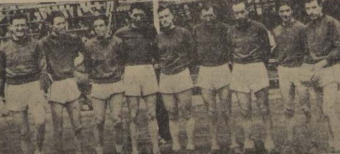
Five de Santiago, vencedor de Sewell

J. D. En la cancha del Estadio de Carabineros se jugó ayer en la mañana el último partido correspondiente a las eliminatorias de la quinta zona, por el Campeonato Nacional de Basketball. La representación de Santiago, se impuso a la de Sewell por la cuenta de 69 puntos contra 41. Este fué el resultado definitivo y exacto de la brega, aun cuando oficialmente, de acuerdo con el cómputo arrojado por la papeleta, se asignaron 67 puntos a Santiago.