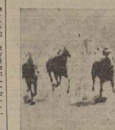
Makassar triunfa sobre Mar Caspio y Fox Terrier en la penúltima carrera matinal

Cost a la vanguardia vigilada por Ovada, quedando tercera Novotomina, cuarta Katiuska, quinta Tonada y al fondo Sep- timio.