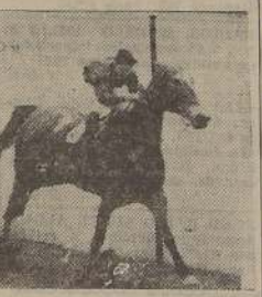
Makassar triunfa sobre Mar Caspio y Fox Terrier en la penúltima carrera matinal

Cost a la vanguardia vigilada por Ovada, quedando tercera Novotomina, cuarta Katiuska, quinta Tonada y al fondo Sep- timio.