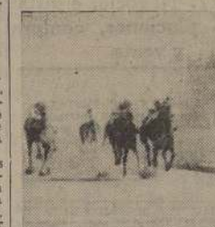
Puntilla reparte el mejor sport de la mañana al vencer a Barilina y Confianza en la tercera