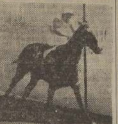
Puntilla reparte el mejor sport de la mañana al vencer a Barilina y Confianza en la tercera

En plena curva, Juventud li- guó a la puntera, y tomando más y más ventaja, se fué al disco en cómodo galope, hasta