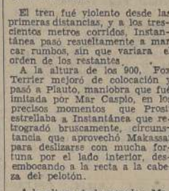
Makassar triunfa sobre Mar Caspio y Fox Terrier en la penúltima carrera matinal

Cost a la vanguardia vigilada por Ovada, quedando tercera Novotomina, cuarta Katiuska, quinta Tonada y al fondo Sep- timio.