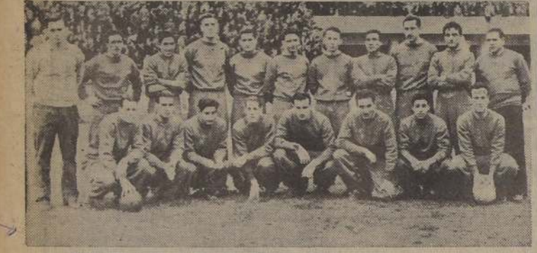
Equipo de la "U", que sigue de puntero en el torneo oficial