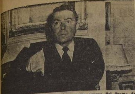
James Mason, el gran actor inglés, en una escena del drama de espionaje "Cinco Días", que el jueves nos presenta el cine Rex.