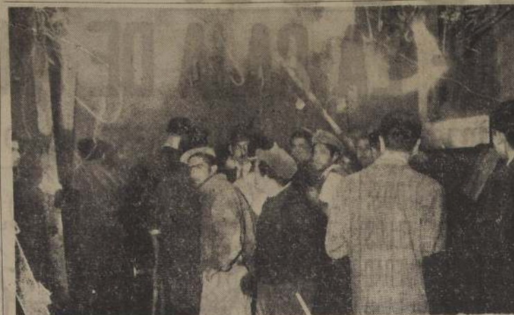
HACIA EL PUNTO DE LA TRAGEDIA. — Un grupo de obreros de la construcción se dirige por los subterráneos del edificio de Alameda con Morandé, hacia el sitio del accidente. Los rostros reflejan la profunda tragedia; la emoción embargaba en aquellos momentos todos los espíritus.