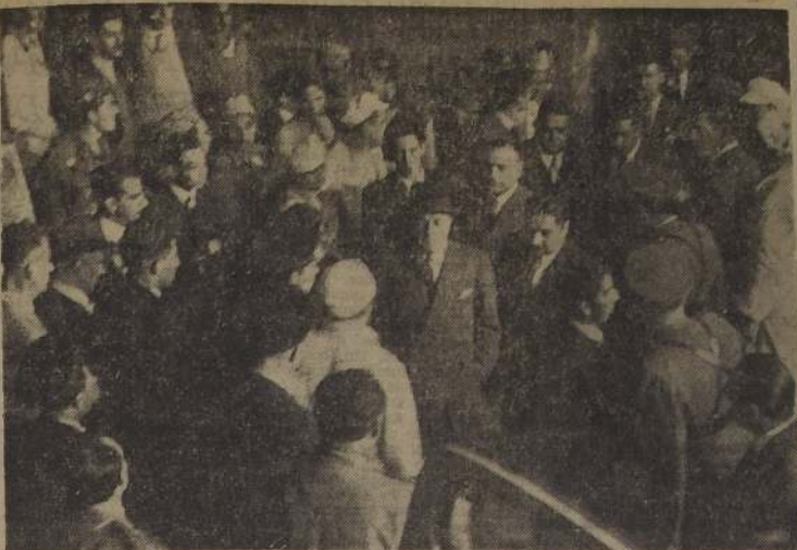
S. E. JUNTO A LAS VICTIMAS.—Apenas ocurrida la tragedia, el Presidente de la República concurrió al edificio en construcción. Posteriormente ordenó el envío de un proyecto de ley, mediante el cual, el Gobierno irá en socorro de las víctimas y de sus familiares.

UNION DE RESISTENCIA DE BUCADEROS Y ALBAÑILES. —Responsabiliza a la firma Berenguer Rios; expresa su condolencia a las familias de las víctimas; acuerda hacerse cargo de los funerales.