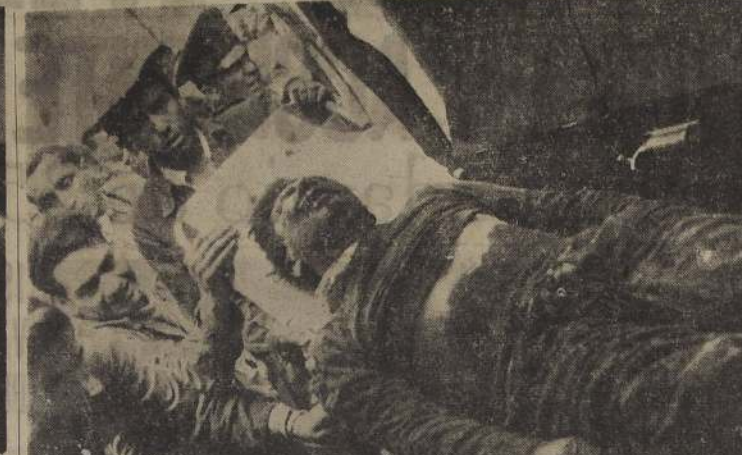
PROCESION DE CADAVERES. — Una macabra procesión de cadáveres desfiló ante los ojos de los fotógrafos. Aquí vemos a otra de las 11 víctimas al ser extraída de los escombros. En una camilla es trasladada hasta un furgón, que lo llevaría más tarde al Instituto Médico Legal. Hasta anoche no había sido identificado. Su viaje postrero lo había hecho anónimamente, así mismo como trabajo durante toda su vida.