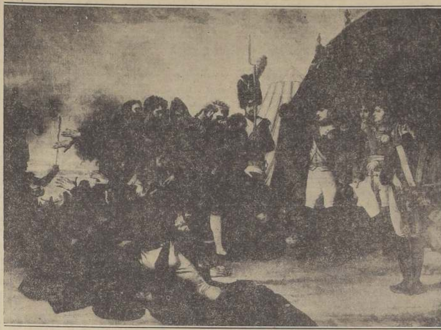
Cinco años antes, España había sucumbido ante las poderosas fuerzas napoleónicas. La capitulación de Madrid, el 4 de diciembre de 1808, ha sido dramáticamente representada por Antonie Jean Gros, en el óleo reproducido en esta ilustración. Pero el transcurso del tiempo y el conocimiento de que Bonaparte estaba ocupado en las fronteras nortea, haciéndole frente a los rusos y los prusianos, y que la alianza de Austria no era ya más que pura fórmula, había hecho que para 1813 los españoles se mostraran inquietos bajo el dominio francés. Tan difícil era la situación al sur de los Pirineos, que Napoleón ordenó a su hermano José, a quien él había coronado como Rey de España, que entregara el mando de su país al Mariscal Soult, Duque de Dalmacia.

"Mi buena Luisa: He recibido tu carta del dos de julio. Estaba quieta por tu salud; me ha alegrado, pues, al sa- ber que te hallabas restablecida. Envío a España al que de Dalmacia. El Rey no entiende nada, y no a sólo no es militar, sino que además no sabe pro- der. Si este Príncipe se traslada a Mortfontaine