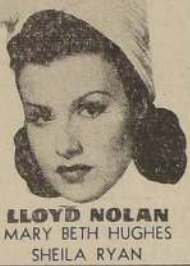
LLOYD NOLAN MARY BETH HUGHES SHEILA RYAN