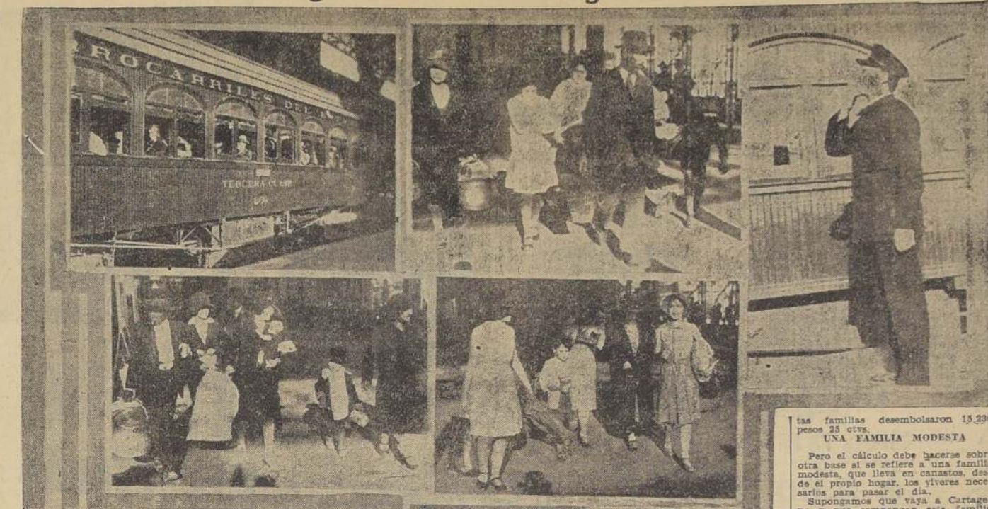
Instantáneas tomadas en la Estación Alameda, momentos antes de la partida del tren excursionista

En contraposición a ellos, los pasajeros del tren especial a Cartagena, Iloilo y San Antonio, son parte de esa multitud con reserva vital, que asiste a los estudios, que vociferan en los campos deportivos, que aúza y ruge en las butacas del ring.