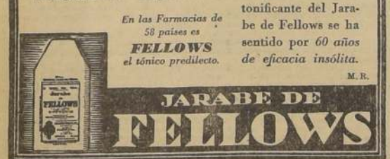
Base: Hierro, quinina, estronina e hipofosfatos de manganeso, potasa, sosa y cal.

La potencia tonificante de las sales minerales y demás valiosísimos elementos científicos combinados hacen del Jarabe de Fellows un reconstituyente de gran alcance que se puede tomar en toda época del año. Es que la enfermedad llama a tu puerta. Prepárate. Recurre al Jarabe de Fellows y no la dejes entrar. Tonifica con él tu sistema nervioso, y con su ayuda imprime vitalidad en tus acciones, revive tu decaído espíritu y asegura la salud que estás en peligro de perder. Recuerda que la influencia tonificante del Jarabe de Fellows se ha sentido por 60 años de eficacia insólita.