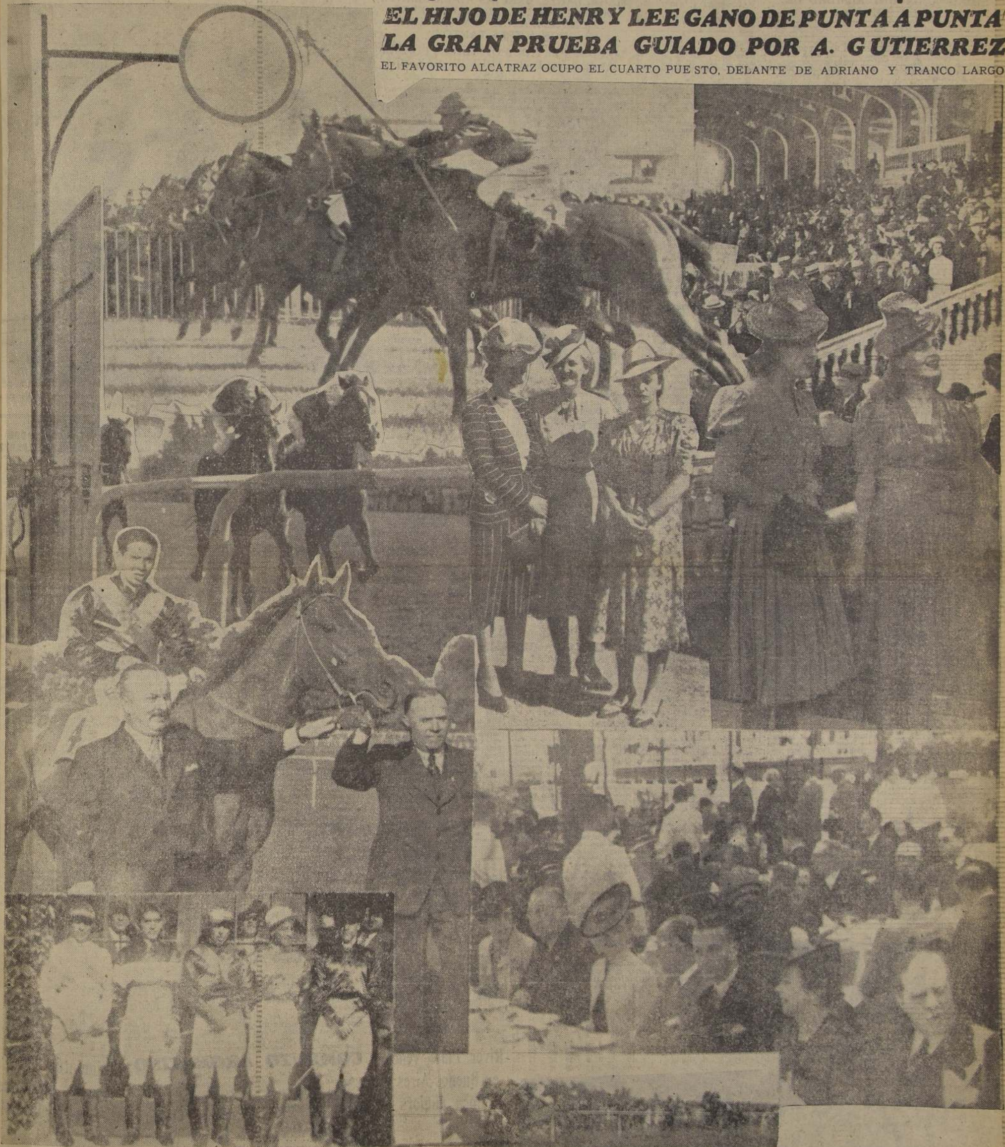
Arriba, la partida de "El Ensayo".—Más abajo, Fouché y Esperanto, luchando palmo a palmo antes del disco, y diversos aspectos de la reunión social de ayer con motivo de la gran carrera

EL FAVORITO ALCATRAZ OCUPÓ EL CUARTO PUESTO, DELANTE DE ADRIANO Y TRANCO LARGO