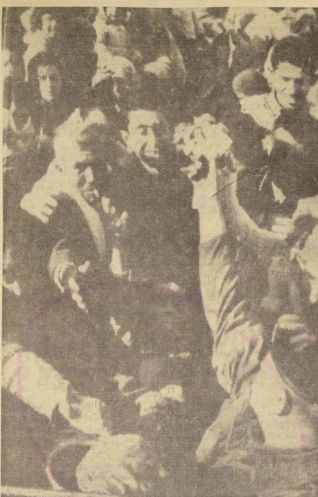
NICOSIA, Chipre. — El Presidente de Chipre, Arzobispo Makarios, aceptará el envío de un observador de las Naciones Unidas, a esa convulsionada isla. La petición fue presentada por el delegado de Inglaterra ante el Presidente de la Organización, U. Thant. En el grabado, tropas británicas reparten alimentos a chipriotas turcos.