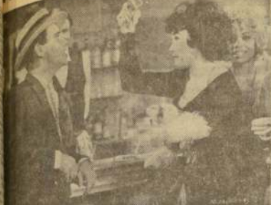
Jack Lemmon no trabaja, vive de su mujer y toma... Ella, Irma (Shirley Mae Lane), que le da su mujer... Las tantas compañeras de la noche, es la pareja esta... la graciosa comedia de Billy Wilder (creador de... y de los Adams) y "Piso de Soltero", "Irma la Dou... y de los Adams", film de Artistas Unidos, será presen... forma simultánea en los cines Central, Huérfanos... y El Golf.