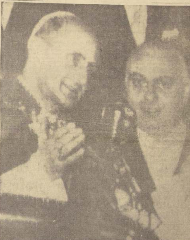
ROMA, Italia. — De regreso de su histórica gira de peregrinación a la Tierra Santa, Paulo VI se dirige a través de los microfonos, el 6, a la multitud que le da una cálida bienvenida, al retornar a esta ciudad. En el grabado, Su Santidad aparece acompañado por el

"Por ahora, el programa de labores del Presidente en 1964 no comprende viaje alguno a Europa", dice el periódico. "Sin embargo, se considera casi seguro que el Presidente italiano, Antonio Segni, invite oficialmente al Presidente de Estados Unidos a ir a Italia en visita oficial. Esto sería equivalente a la reiteración de la invitación hecha a John F. Kennedy, que había aceptado."