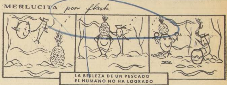
LA BELLEZA DE UN PESCADO EL HUMANO NO HA LOGRADO

Nosotros propusimos, dijeron, en forma concreta una variante que permitiría la habilitación de ese camino a muy bajo costo y que comprendería una extensión aproximada de 30 kilómetros del lago chileno, ya que el sector ar-