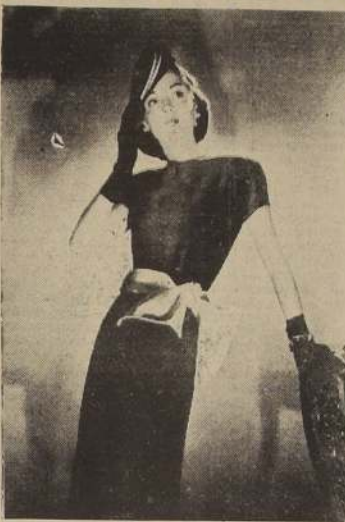
Vestido de día, de sutil silueta. Color negro o azul marino, con medio cinturón, falda de piqué blanco. (Modelo Bendel)

EL TRAJE MEDIO SASTRE MERECE ESPECIAL ATENCION