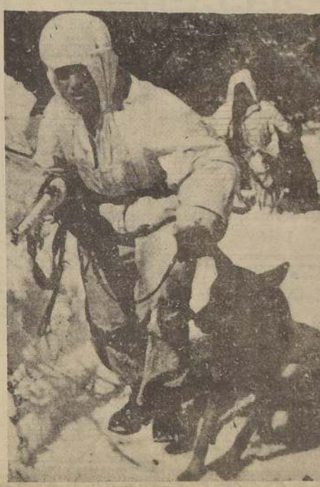
Escenas de la guerra en Rusia

La plaza de Krivoy-Rog está siendo cercada desde 3 lados