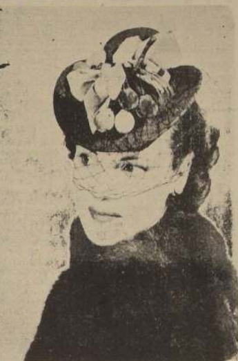
Sombrero en sugestivos colores, que imparte una nota alegre a vestidos oscuros. De fieltro rojo con un ramito de cerezas de terciopelo, lazo de terciopelo matizado rosa y dronda de terciopelo chartruese. El velo es de malla negra. (Modelo Bendel)

NUEVA YORK, enero 31. — Como es bien sabido, las modas nacieron de la inspiración, del intenso trabajo y esfuerzo coordinado de diseñantes creativos. Los diseñantes Bendel tienen el doble trabajo de crear dos colecciones: una colección de sombreros que presentará formalmente a la prensa a mediados del mes de febrero, y la colección completa de modas que presentará a principios del mes de marzo. Los nuevos sombreros acusan una diferencia radical a los estilos que prevalecieron en las estaciones pasadas. Son bien calzados a la cabeza en vez de ajustarse en precario ángulo.