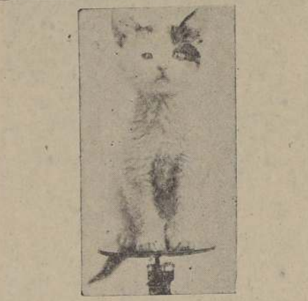
HAY QUE ESTAR ALERTA

ARREGLAMOS BOTAS DE agua para mineros a bo-degas. Neumáticos. Casa Goveche. Avenida 157-1135. Teléfono 68100.