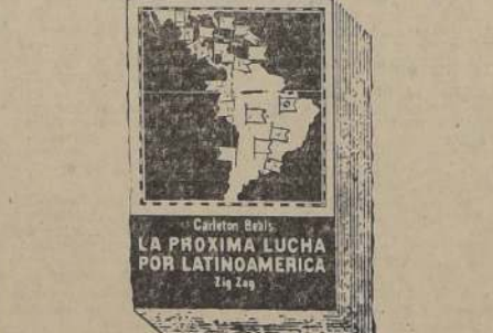
POR CONQUISTAR LATINOAMERICA

"Todos los países, incluyendo el mío propio, tienen un servicio organizado de espionaje para averiguar lo que sucede alrededor de los puentes y arse nales extranjeros".