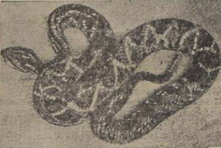
PORQUE EL ESPIONAJE TRABAJA