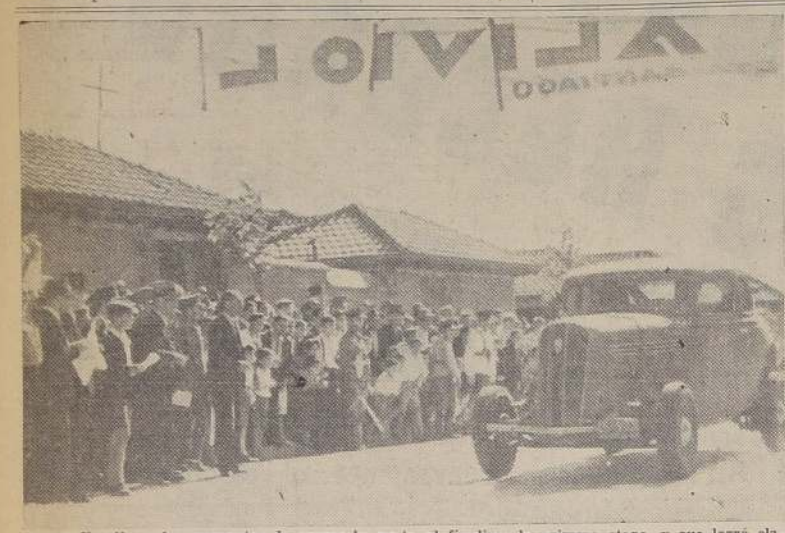
Varoli, en los momentos de cruzar la meta al finalizar la primera etapa, y que logró clasificarse en el cuarto lugar de la carrera finalizada en Concepción