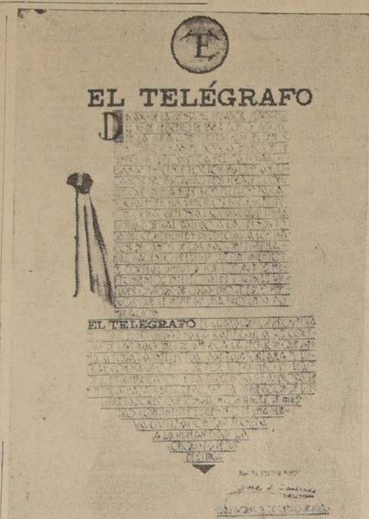
El pergamino por medio del cual el diario "El Telégrafo", de Guayaquil, saluda a la prensa del Continente.