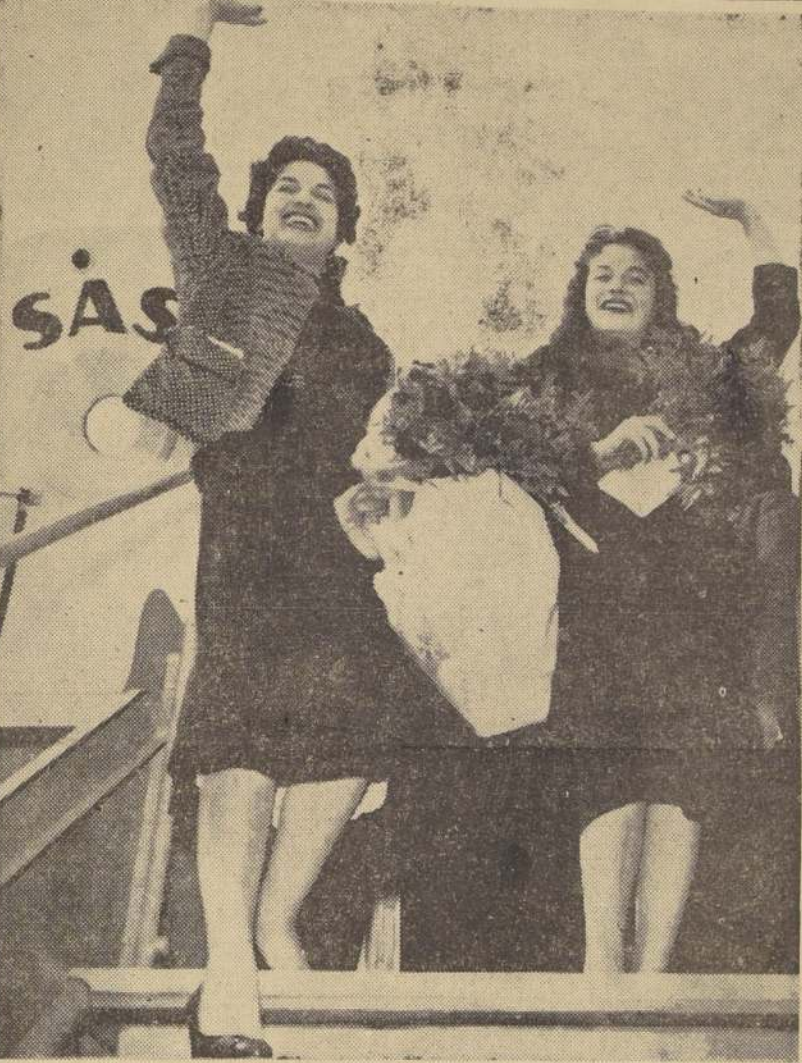
REGRESARON A LA PATRIA. — Ayer a bordo de una de las máquinas de itinerario de la Scandinavian Airlines System (SAS), regresaron a Santiago, después de permanecer 13 días en Uruguay, Ma-