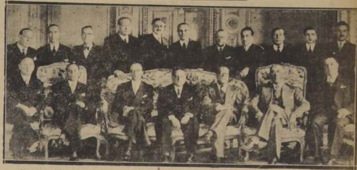
Los asistentes a la sesión del Consejo Superior del Bando de Piedad de Chile

IMPORTANTE SESION DE ANIVERSARIO CELEBRO SU CONSEJO SUPERIOR, EN LA QUE SE INCORPORARON LOS NUEVOS CONSEJEROS, LOS EMBAJADORES DEL BRASIL Y PERU