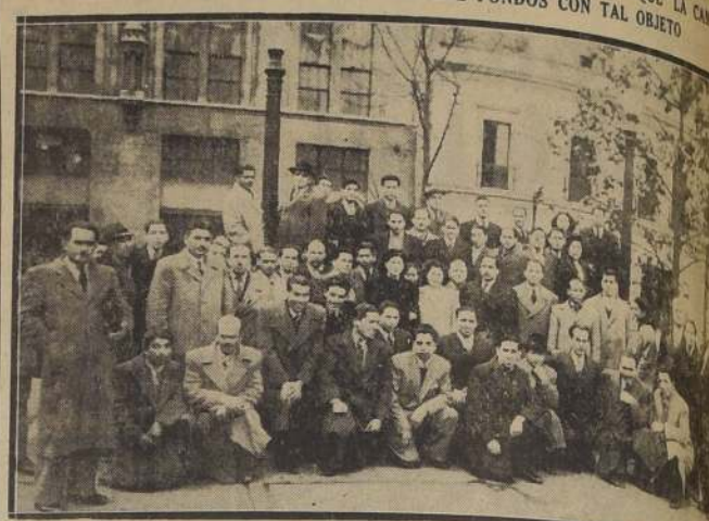
Grupo general de los dirigentes de organizaciones gremiales de la Beneficencia que van el mejoramiento de su situación económica.

DIRIGENTES DE SUS ORGANIZACIONES GREMIALES CONFIAN EN QUE LA CAM- TRATE HOY EL MENSAJE QUE CONDEE FONDOS CON TAL OBJETO