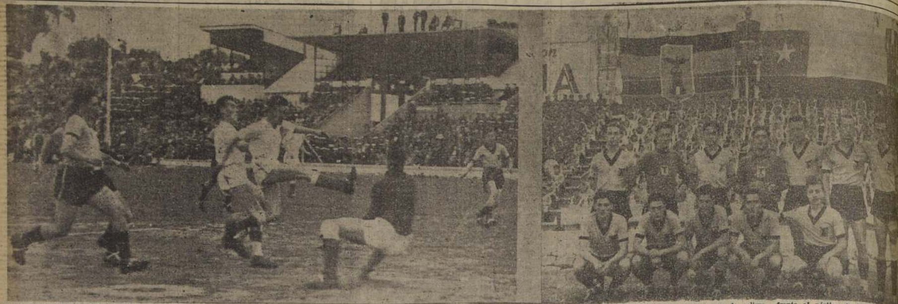
DE LA OLIMPIADA MILITAR.— Dos aspectos del match de fútbol efectuado el día inaugural de la Olimpiada y en el que la Escuela Militar se impuso a la Naval por 2 a 1. A la izquierda, una escena de peligro frente al pórtico de los porteros. En seguida, el conjunto ganador.