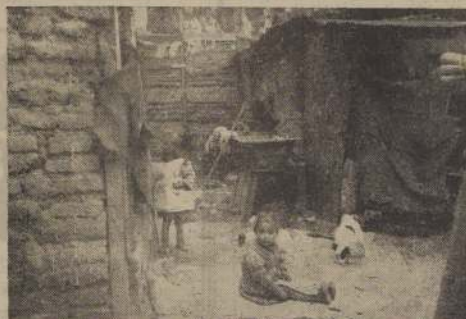
Una choza ubicada en la calle Los Olmos esquina de Joaquín Rodríguez, que se arrienda en $ 160 mensuales. — Es parte de 30 ranchos similares