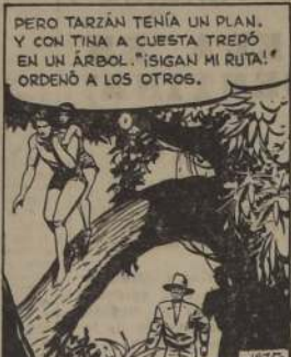
PERO TARZAN TENIA UN PLAN. Y CON TINA A CUESTA TREPÓ EN UN ARBOL. "¡SIGAN MI RUTA!" ORDENÓ A LOS OTROS.