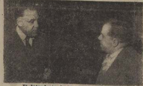
El Intendente de Maule, en LA NACION