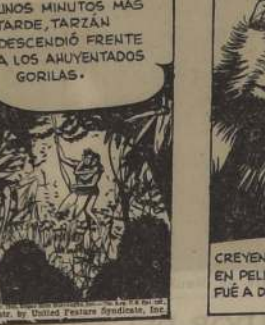
UNOS MINUTOS MÁS TARDE, TARZAN DESCENDIÓ FRENTE A LOS AHUYENTADOS GORILAS.