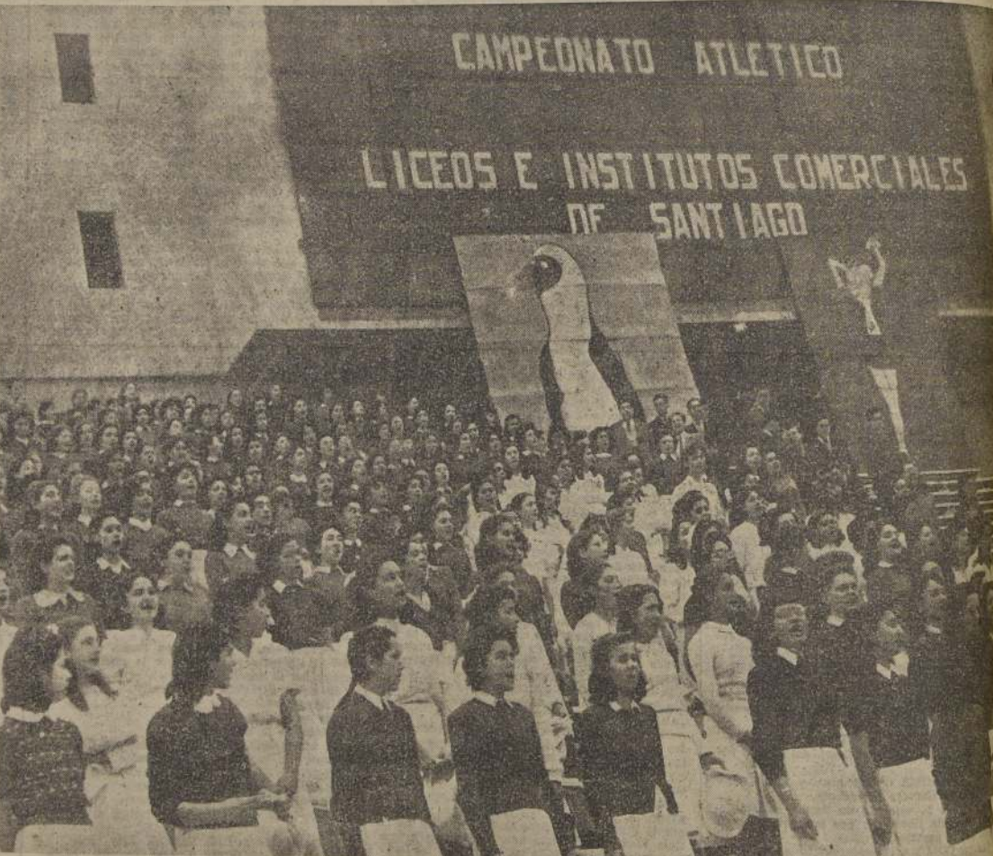
La disciplinada "barra" del Liceo N.º 1 de Niñas, de lucido comportamiento en el torneo de atletismo.