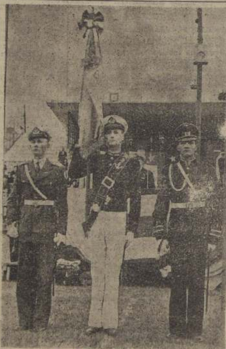
Abanderados de las Escuelas de Aviación, Naval y Militar.