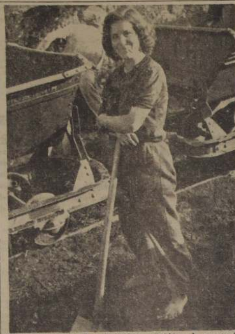
ZONA SOVIETICA DE ALEMANIA.— Debido a la escasez de mano de obra masculina en Seifenburg, Sajonia, todo el acarreo y transporte de carbón en las minas de la zona, es hecho por mujeres. Como es casi imposible adquirir un par de zapatos, las mujeres se ven obligadas a trabajar a pies descalzas. Todos los hombres han sido llevados a trabajar a las minas de uranio cercanas.

Hernández terminó haciendo una ferviente petición por ayuda para Colombia y los demás países latinoamericanos y dijo "el Banco y Fondo tienen que ayudarnos". Manifestó que para lograr eso "la política de Colombia tiende a lograr que el Banco adopte la política de hacer empréstitos que ayuden a los países del centro y orientar sus balances de pagos. Declaró, finalmente, que "tenemos que disfrutar de la riqueza internacional".