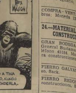
CREYENDO A TINA EN PELIGRO, KANGU FUÉ A DEFENDERLA.

FARMACIA de TURNO PERMANENTE HASTA LA UNA DE LA MADRUGADA