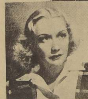
Miriam Hopkins, a quien veremos próximamente en el reparto de "La Solterona", se coloca el rouge bajo los pómulos para echar una sombra sobre las maxilares que tiene algo prominentes.