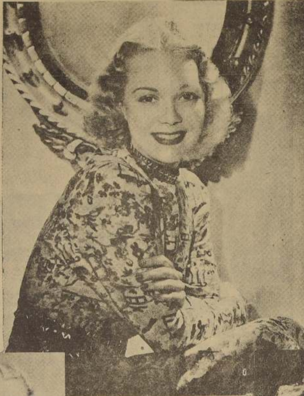
Jane Wyman en "La Batalla de City Hall", emplea un polvo mucho más claro sobre su nariz, que es corta y pequeña, que sobre el resto de la cara.

Los grandes modistos y peloteros parisenses han brozado para Nueva York un fresco magistral. Su éxito ha sido considerable, y nos rescata, porque ha venido a recompensar un magnífico esfuerzo.