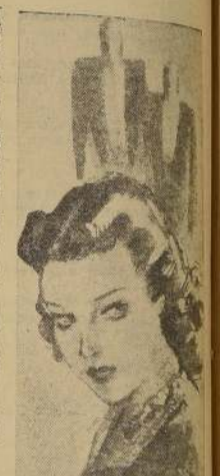
Isolda, Romeo y Julieta, tengo mis dudas al respecto al mejor son únicamente fruto de la imaginación de los poetas, porque confieso que ahora jamás los he encontrado pisando tierra firme. En otros amores, en cambio, me he sentido tan segura, pero me he sentido terriblemente humana y ante esos me inclino.

Ya que en un hogar, es imposible limitar el tiempo consagrado al trabajo, es necesario