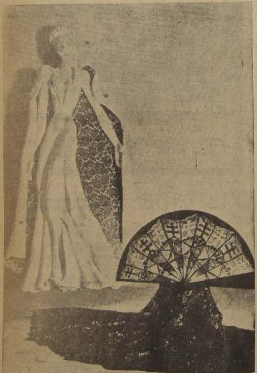
El bajorrelieve de la Casa Worth tal como ha sido presentado a la Exposición de Nueva York.

Los grandes costureros y peloteros de París han participado en la Exposición de Nueva York, en forma sumamente original y novedosa.