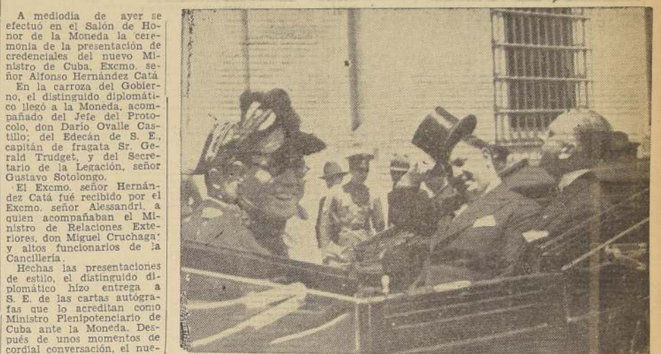
El Excmo. señor Alfonso Hernández Catá, Ministro de Cuba, al presentar sus credenciales al Excmo. señor Alessandri, a quien acompañaban el Ministro de Relaciones Exteriores, don Miguel Cruchaga, y altos funcionarios de la Cancillería.

Hechas las presentaciones de estilo, el distinguido diplomático hizo entrega a S. E. de las cartas autógrafas que lo acreditaban como Ministro Plenipotenciario de Cuba ante la Moneda. Después de unos momentos de cordial conversación, el nuevo representante del país amigo se retiró de la Moneda.