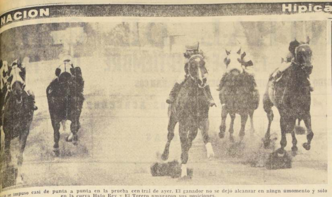
Se impuso casi de punta a punta en la prueba central de ayer. El ganador no se dejó alcanzar en ningún momento y solo en la curva Hato Rey y El Torero amagaron sus posiciones.