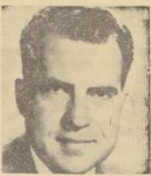
RICHARD NIXON CEREBRO ELECTRONICO PARA NIXON