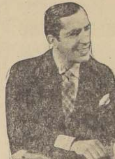
Un éxito rotundo han sido las funciones rotativas 1952 inauguradas por la Empresa Chilena Cóndor en el Teatro Caupolicán. Ayer miércoles, desde las 3 de la tarde, numeroso público agotó las localidades altas y bajas del teatro.

Hoy cantan nuevamente en el Teatro Chileno Cóndor, el Zorral Criollo Carlitos Gardel, la voz de oro de América, Libertad Lamarque, Hugo del Carril y Amanda Ledesma