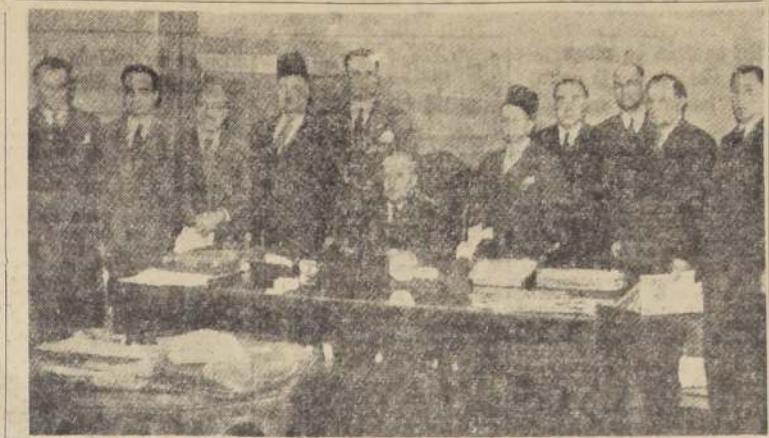
EL NUEVO GOBIERNO EN SIRIA. — En un cuarto golpe de Estado —en tres años— el Coronel Fawzi Selou es ahora Primer Ministro y Ministro de Defensa. Lo llevó al Poder el golpe del Jefe del Estado Mayor, comandante Adib Shesheky.