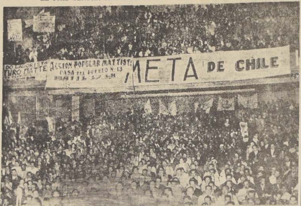
Aspecto que presentaba anoche el Teatro Victoria de esta capital, durante la proclamación del candidato nacional a la Presidencia de la República, Arturo Matte, por las juventudes de Santiago, reunión que alcanzó grandes caracteres.

"EL PAIS TENDRA ABUNDANCIA Y LAS MASAS BIENESTAR"