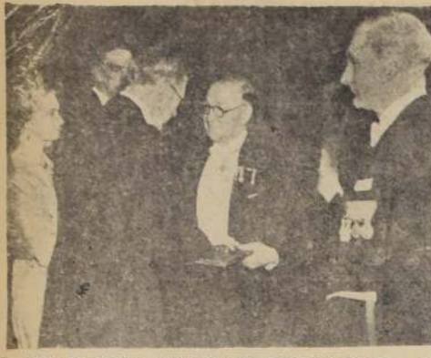
EL REY DE SUECIA OTORGA EL PREMIO NOBEL. — El sabio atómico británico, Sir John Cockcroft, recibe en Estocolmo el Premio Nobel de Física 1951.