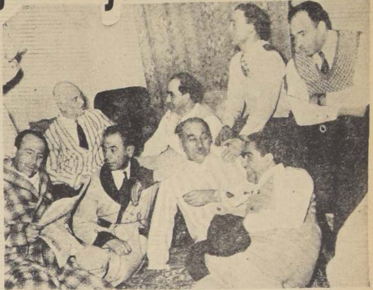
PERIODISTAS PERSAS SE REFUGIAN EN EL PARLAMENTO. — El Majlis, Congreso Nacional del Irán, y que es inviolable, es el refugio ahora de los directores de diarios opositores al Primer Ministro Dr. Mossadegh. "No lo abandonaremos hasta que caiga su gobierno", han dicho. — (Foto The Sphere).