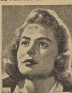
Ingrid Bergman es la estrella de la película "Cuentame tu vida".

Uno de los grandes éxitos de David O. Selznick ha sido el film "Cuentame tu vida", donde actúa la actriz Ingrid Bergman con Gregory Peck, bajo la dirección de Alfred Hitchcock. Ingrid Bergman hace alarde de su habilidad dramática en este film que estrena el martes próximo en el Teatro Central. Esta actriz conquistó el premio de la Academia en su caracterización. Su actuación, junto a Gregory Peck y a un gran reparto, hacen de este film una obra de calidad artística.