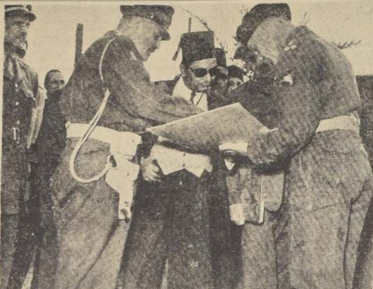
EGIPCIOS Y BRITANICOS DISCUTEN. — El Gobernador de Suez, Ibrahim Zouki El Khoul, discute con el general británico, Greenacre, sobre los planes de construcción de un nuevo camino por la zona del Tratado.

El anuncio de la Casa Blanca decía que el plan presidencial tenía por objeto "impedir las actividades impropias en los asuntos públicos, proteger al Gobierno contra los vendedores de influencia y los que tratan de obtener favores y castigar a los que no cumplan con su deber".