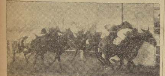
Nueva bate a Gamazo, Ivanita y Junquillar

de Pícaro, en tercer término, actuaba Breal y a continuación Sayal, Cien y Cien, Saludo y Gabacha.