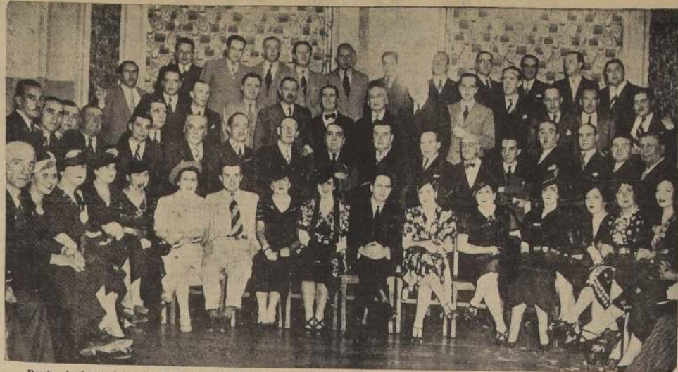
Parte de los asistentes al banquete ofrecido anoche al Ministro del Interior y señora de Alfonso

Anoche se efectuó en el Club Coquimbo-Atacama la manifestación ofrecida por sus compromeñados al Ministro del Interior, don Pedro E. Alfonso y señora.