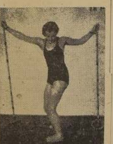
Figura 16. E.—Levántese en seguida la pierna izquierda, dada vuelta hacia afuera, rodillas en flexión de los pies hacia arriba, hasta la altura de la cadera...