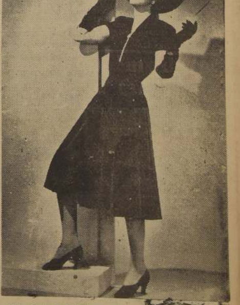
Esta silueta de Robert Piguet se presta especialmente para las reuniones elegantes de la tarde. Está hecha en crepe negro, pesada. El cierre es de fantasía, adornado de pedrerías, que hace juego con los clips para las orejas. Completan la tenida, un sombrero de fieltro negro sedoso, y guantes de gamuza, negros también.