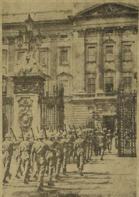
Por la primera vez en la historia, un destacamento de canadienses franceses entra al palacio real de Buckingham para hacerse cargo de la guardia de honor, bajo la mirada de los soberanos ingleses. (Fotografía publicada en "L'Illustration" de París del sábado 27 de abril último) CORTESIA DE AIR-FRANCE