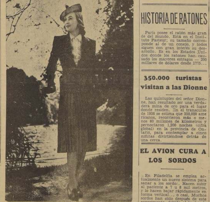
Este traje sastrero de fantasía lo ideó Worth en un género azul marino, con rayas blancas, fabricado especialmente para el por Ramond. La blusa de muselina bordada le presta gran encanto, y subraya aun más la nota juvenil de esta tenida.