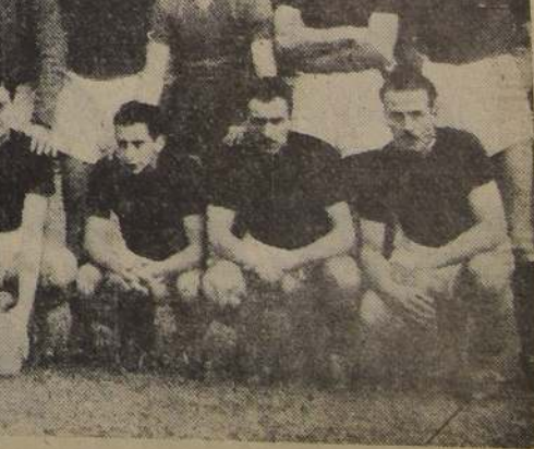
El entusiasta y eficiente cuadro de la Unión Española, que se impuso al Magallanes, por 3 a 1. Los rojos de Santa Laura actuaron conforme a sus lucidas campañas realizadas en lo que va del año.

La misma prestandia y regularidad del comienzo de la justa.