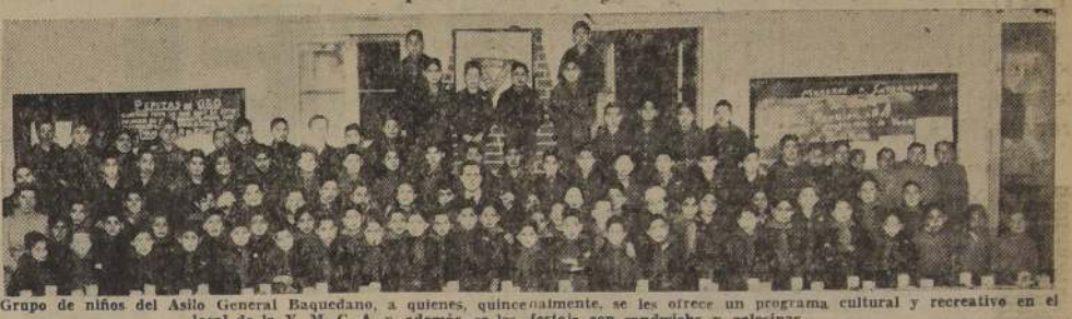
Grupo de niños del Asilo General Baquedano, a quienes, quincenalmente, se les ofrece un programa cultural y recreativo en el local de la Y. M. C. A.; además, se les festeja con sandwiches y golosinas.

Su obra a favor de la gente necesitada.— Su nuevo Director Técnico llegará luego procedente de México