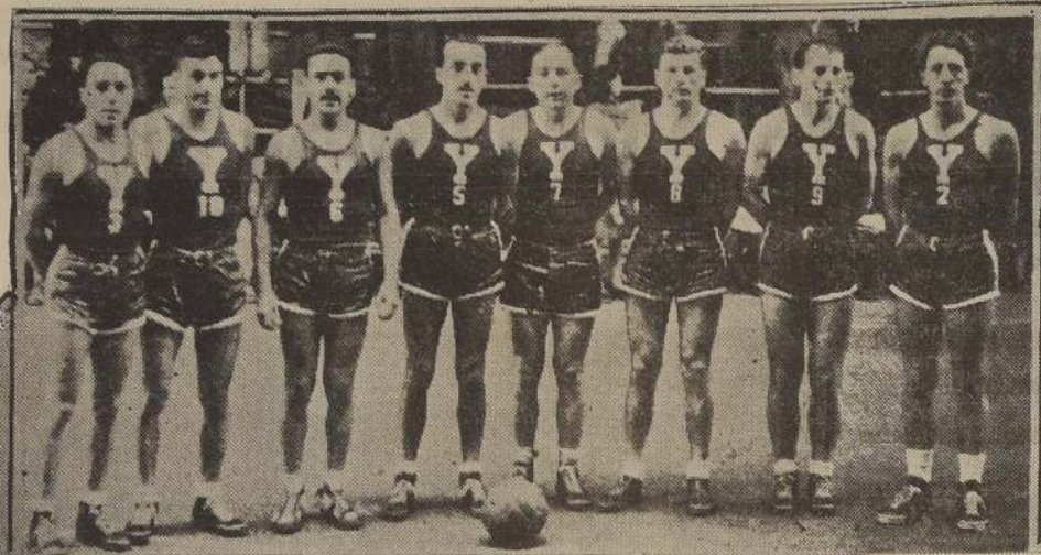
Integrantes de la Asociación Cristiana de Jóvenes, campeón de apertura de basketball.

SE IMPUSO EN LA MAÑANA DE AYER AL DEPORTIVO SIRIO, FACILMENTE, POR EL SCORE DE 48 POR 29