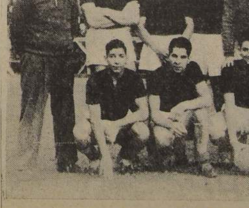
El entusiasta y eficiente cuadro de la Unión Española, que se impuso al Magallanes, por 3 a 1. Los rojos de Santa Laura actuaron conforme a sus lucidas campañas realizadas en lo que va del año.

A continuación se dió el anuncio del resultado que coronó los esfuerzos y la dedicación, tantas veces probada, de Guillermo García Huidobro. La nueva marca continental, fue pues de 4 minutos 15 segundos 8 10.