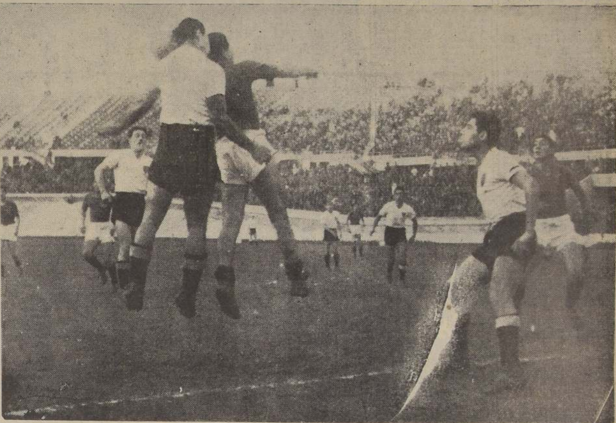
Camus y Mociola se disputan el balón en un salto difícil y estando próximos al pórtico de Eraso. Colo Colo va mejorando paulatinamente. Este año pocos han logrado derrotar al Audax con la facilidad que lo hicieron los albos ayer.

AUDAX ITALIANO (verdes): Jones; Cortés (capitán) y Roa; Arancibia, Sepúlveda y Trejos.