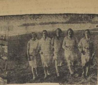
Alegres grupos de veraneantes en este hermoso balneario