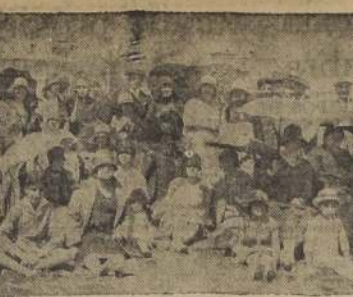
Alegres grupos de veraneantes en este hermoso balneario