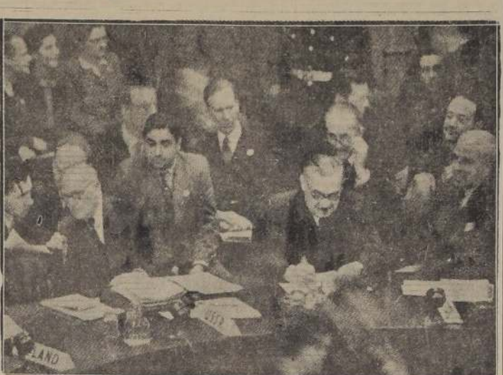
En la presente fotografía tomada durante la reunión del Consejo de Seguridad, aparecen de izquierda a derecha en el primer plano, Gromyko, Andrei Vishinskiy, Ernest Bevin y Edward Stettinius. Detrás de ellos los asesores de los representantes ruso, británico y norteamericano.

El martes el Secretario de Estado se reunió en una conferencia de prensa su respuesta anterior, diciendo que el señor Braden nada había dicho que no estuviese contenido en el Libro Azul.