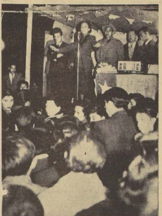
MARIA DE LA CRUZ HABLA A POBLADORES DE CERRO NAVIA.— Ante varios miles de pobladores de sector norte de la comuna de Barrancas, María de la Cruz, pronunció anoche un vibrante discurso, en el que destacó la necesidad patriótica de respaldar la acción gubernativa de S. E. el Presidente de la República. En la foto, la líder de la Unión Nacional Laborista al momento de pronunciar su discurso.

La senadora María de la Cruz, que se refirió, en forma debilitada, a la necesidad de reservar la economía del país en la cuestión de la inflación, habló ante la población obrera de la comuna de Barrancas.