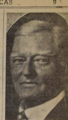
Mr. John N. Garner, Vice-presidente

Política estadounidense y británica de mutua colaboración simplificarían también la realización del propósito de Roosevelt, de estabilización de los cambios desde Estados Unidos y el Reino Unido controlen los factores más importantes de cualquier plan de estabilización.