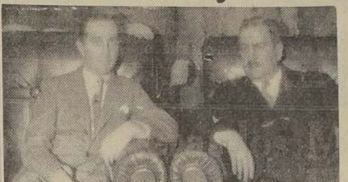
El nuevo Ministro del Trabajo, don Alejandro Errázuriz, acompañado del doctor señor Fajardo momentos después de hacerse cargo del Ministerio

Los médicos de Sanidad, prosiguió el Ministro, me expusieron que, por lo general no se cuentan con la suficiente preparación para sus actividades. Yo les prometí, agregó, darles estabilidad en sus cargos y contribuir a la creación de una honrosa tradición de firmeza, idoneidad y eficacia en todos los servicios de Sanidad.