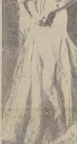
A usted, seguramente, le gustará el baile. Sin embargo, en la actualidad se baila