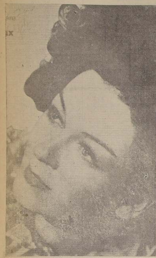
Se comprende fácilmente, al mirar esta fotografía, el fervor que los jóvenes norteamericanos sienten por la encantadora Rosalinda Russell