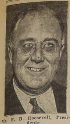
Mr. F. D. Roosevelt, Presidente

Prometedoras perspectivas rodean este nuevo periodo. — El comercio se desarrolla favorablemente y el resurgimiento continúa dejándose ver. — Las industrias están trabajando casi al máximo de su capacidad. — Roosevelt buscará una situación financiera holgada sin recurrir a la inflación. — Es posible que haya agitaciones obreras, pero se- rian el movimiento lógico de la tendencia al alza de los precios. — Las relaciones exteriores se pre- sentan también en una atmósfera despejada