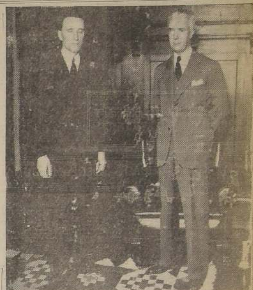
El nuevo Ministro de Salubridad doctor don Eduardo Cruz Coke, acompañado del ex Ministro don Joaquín Prieto Concha, ayer después de la entrega del Ministerio