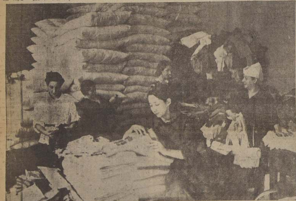
En el Almacén de Vestuario de la Escuela Técnica Femenina, cada una cumple su tarea como simple obrera de una fábrica.

Y así seguiríamos dando nombres y nombres, pues son centenares y centenares de mujeres las que en forma anónima o destacada por las circunstancias trabajan en el plan de reconstrucción del país.