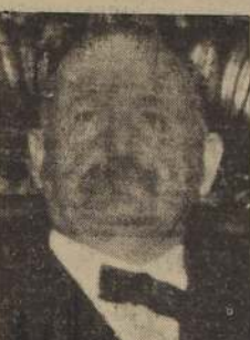
Senador Liberal don Pedro Opaz Leñel