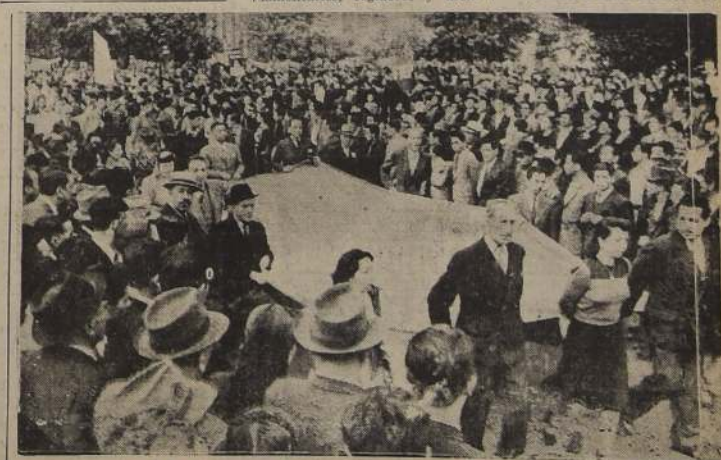
Uno de los Grupos Funcionales del Partido Radical, desfilando