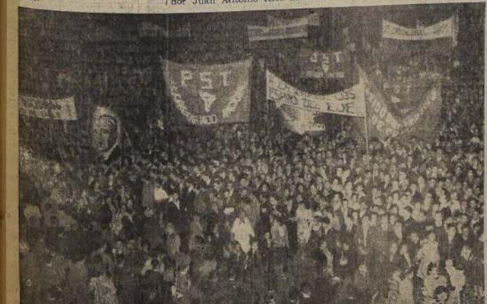
Un aspecto del desfile patriótico en la Plaza Constitución

Esta magnífica recepción po- pular duró varios minutos, y fue necesario pedir a la con- fuerza que cesara en sus aclamaciones, para que pudiese darse comienzo a los dis- cursos.