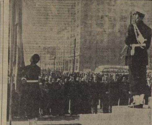
HOMENAJE A O'HIGGINS Y SAN MARTIN.—Organizado por la Acción Chileno-Argentina se efectuó ayer a las 11.30 horas un homenaje a O'Higgins, colocando una ofrenda floral en su monumento, como acto inicial de la Semana de O'Higgins, que se desarrolla en conmemoración de un nuevo aniversario del natalicio del prócer.