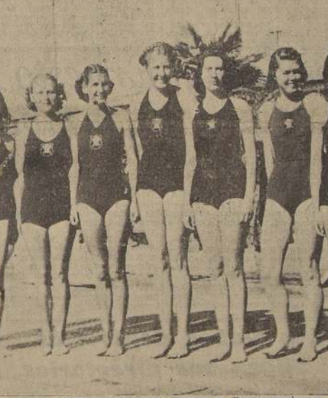
El excelente conjunto de nadadoras del Country Club que actuaron en diversas pruebas en el certamen de ayer.

El equipo de los españoles que hoy por hoy es el mejor conjunto de waterpolo del país, se impuso fácilmente por 4 a 0 a un combinado que se formó a