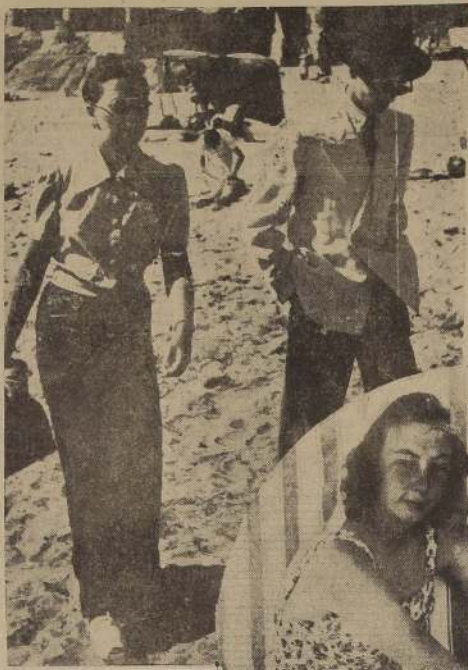
Toda la desgracia del hombre viene de que no quiere comprender que no es sino uno que pasa. Maeterlinck