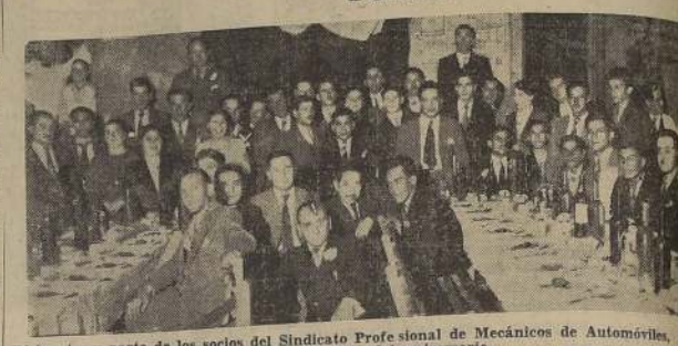
Dirigentes y parte de los socios del Sindicato Profesional de Mecánicos de Automóviles en la celebración del aniversario.

Fué celebrado dignamente con asamblea solemne y un banquete