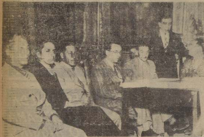
La Mesa Directiva que presidió la reunión inaugural del Congreso de Empleados de Beneficencia, con asistencia del representante del señor Ministro de Salubridad.

La asamblea dejó constancia de su reconocimiento al Ministro de Salubridad y Junta Central de Beneficencia— Hoy se aprobarán conclusiones