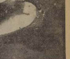
El gran nadador panameño Eddie Wood se impulsó en los 100 metros estilo libre, luchando palmo a palmo con Walbridge, el otro nadador panameño que actuó en el torneo.

2.º Badminton, 29 3.º Prince of Wales, 28 1/2 4.º Alemán, 25 5.º Univ. de Chile, 19 6.º Tracción Eléctrica, 12 7.º Green, Cross, 8