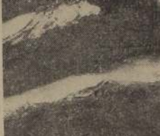
El gran nadador panameño Eddie Wood se impulsó en los 100 metros estilo libre, luchando palmo a palmo con Walbridge, el otro nadador panameño que actuó en el torneo.

2.º Badminton, 29 3.º Prince of Wales, 28 1/2 4.º Alemán, 25 5.º Univ. de Chile, 19 6.º Tracción Eléctrica, 12 7.º Green, Cross, 8