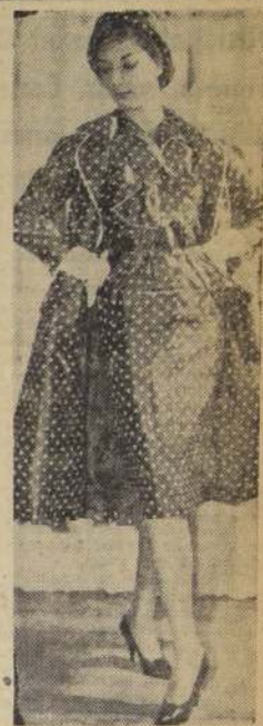
DE LONDRES y exhibido en la colección de Rabbis. Vestido de foulard de lunares blancos, en fondo azul marino. El tapado es del mismo género. Se completa con un pequeño sombrero, que deja al descubierto la cara.

Las adhesiones se reciben en la caja de dicho establecimiento.