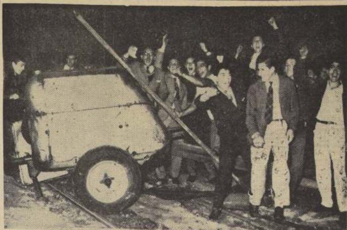
BUENOS AIRES.— Un grupo de manifestantes toma un remolque para levantar barricadas durante una huelga general, decretada por elementos peronistas y comunistas el 15 de mayo, en apoyo del movimiento que realizan los empleados bancarios.

EL DIRECTORIO Entrada libre — Locomoción: Micros Avda. España-Larrain; Buses Recoleta-Plaza Ossandón; buses 24 Mapocho-Aeródromo de Tobalaba. A los niños se les obsequiará Coca Cola.